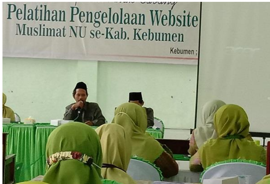
Gambar 5. Pengguna Layanan Memperoleh Pelatihan

Gambar 5 Tim sedang melakukan pelatihan pengelolaan website kepada para pengurus PC dan PAC muslimat NU.