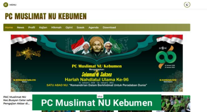
Gambar 2. Tampilan Website Muslimat NU dengan Laman https://muslimat.or.id/ Masyarakat dapat membaca berita-berita yang sudah diposting oleh admin pengurus muslimat NU, seperti pada Gambar 3.