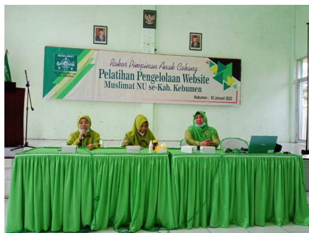
Gambar 4. Koordinasi Tim Pengabdian Kepada masyarakat dalam pelaksanaan kegiatan

Koordinasi tim pengabdian kepada masyarakat dalam pelaksanaan kegiatan dapat dilihat pada Gambar 4.