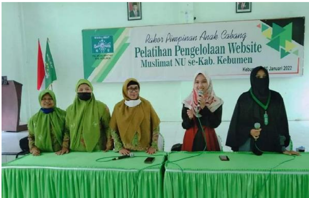
Gambar 6. Tim Pengabdian Kepada Masyarakat Beserta Pengurus Melakukan Foto Bersama

Setelah menyelesaikan pelatihan selesai para instruktur dosen, mahasiswa Politeknik Piksi Ganesha dan pengurus melakukan foto bersama