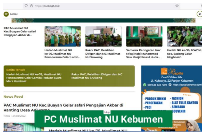
Gambar 3. Tampilan Berita

Koordinasi tim pengabdian kepada masyarakat dalam pelaksanaan kegiatan dapat dilihat pada Gambar 4.