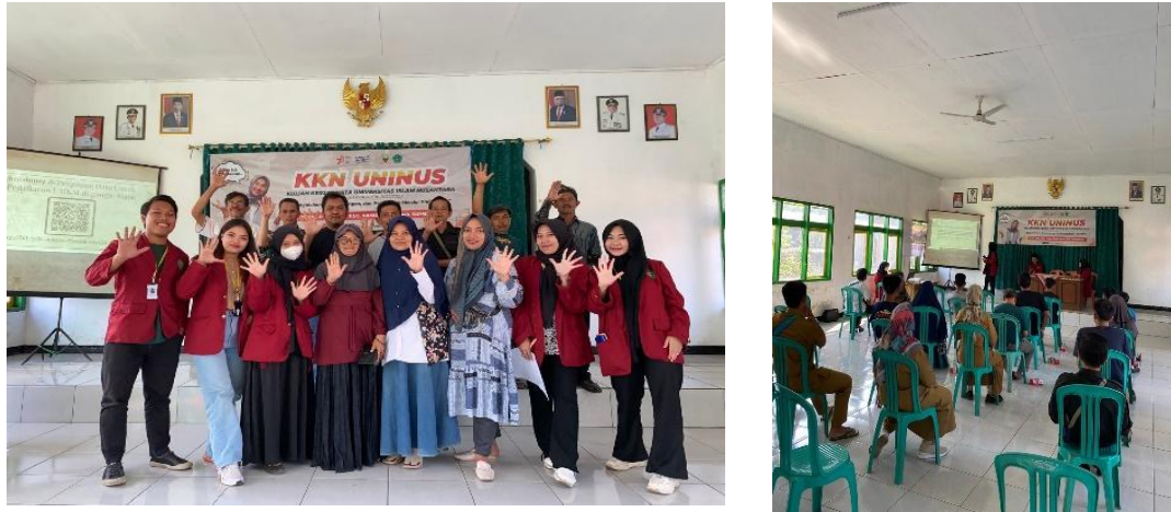
Gambar 4. Sosialisasi strategi pengembangan bisnis berbasis teknologi di era digital

Hasil kegiatan KKN Tematik Penyuluhan, Pendampingan, Pembinaan Melalui Digitalisasi di Desa Ciptasari, Kabupaten Sumedang, tahun 2023, mencerminkan upaya nyata dari mahasiswa Universitas Islam Nusantara untuk memberikan kontribusi positif kepada masyarakat setempat. Dalam pembahasan ini, akan dianalisis beberapa aspek penting dari kegiatan tersebut.