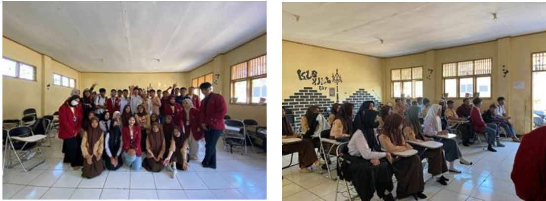
Gambar 3. Penyuluhan pentingnya pendidikan tingkat tinggi

Program kerja utama lainnya yaitu sosialisasi strategi pengembangan bisnis berbasis teknologi. Hasil observasi yang dilakukan diperoleh informasi bahwa pemilik UMKM di Desa Ciptasari yang masih kurang dalam pemahaman manajemen usaha dan pemasaran di bidang digital, sehingga perlu dilakukan sosialisasi. Dengan maksud membantu masyarakat dalam hal Digital Marketing , maka dilaksanakan sosialisasi dengan 5 tema yaitu tentang kewirausahaan; digital marketing ; Branding Produk, Standarisasi dan Legalitas Usaha; Pengelolaan Keuangan dalam Berbisnis; dan Integrasi UMKM pada Google Maps. Target utama program kerja ini yaitu pelaku UMKM di Desa Ciptasari, Kecamatan Pamulihan, Kabupaten Sumedang. Program ini dilaksanakan pada tanggal 21 Agustus 2023 di Balai Desa Ciptasari,