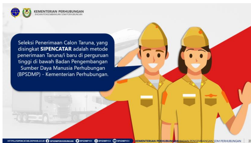
Gambar 9. Seleksi Penerimaan Calon Taruna (SIPENCATAR)

Diharapkan materi yang disampaikan oleh narasumber kedua akan membantu siswa memahami lebih baik proses pendaftaran dan seleksi penerimaan calon taruna di Politeknik Perkeretaapian Indonesia Madiun. Selain itu, informasi yang disampaikan kepada siswa akan membantu siswa mempersiapkan diri sebaik mungkin untuk proses seleksi tersebut. Dengan memahami secara keseluruhan proses penerimaan calon taruna ini, diharapkan siswa akan memiliki peluang yang lebih besar untuk diterima di perguruan tinggi kedinasan Kementerian Perhubungan khususnya Politeknik Perkeretaapian Indonesia Madiun.