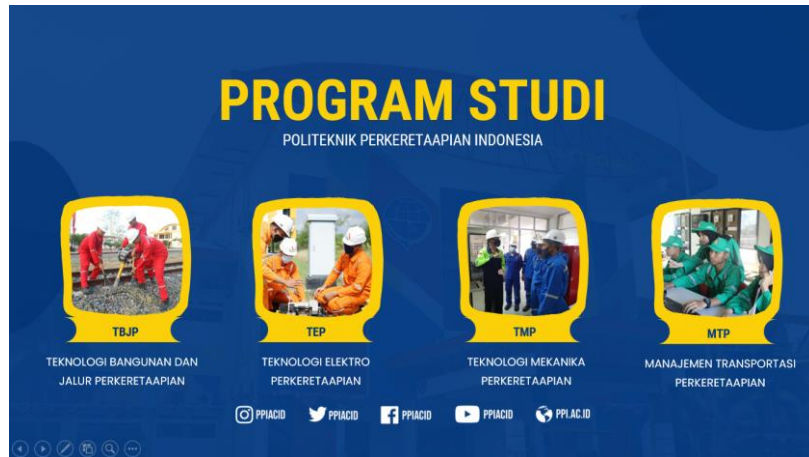
Gambar 6. Program studi yang terdapat di Politeknik Perkeretaapian Indonesia Madiun

berbagai program studi yang terdapat di Politeknik Perkeretaapian Indonesia Madiun dan menekankan keunggulan dan keistimewaan masing-masing program studi tersebut.