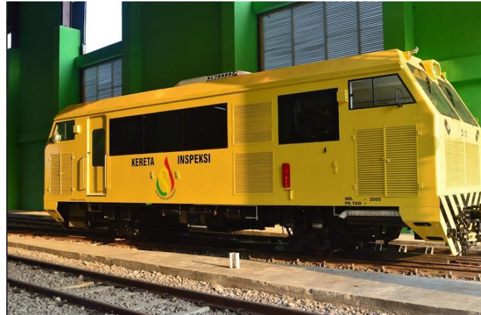
Gambar 1. Kereta inspeksi

taruna. Selain itu, kereta inspeksi juga dapat digunakan sebagai penelitian dosen dan taruna. Kereta inspeksi pun digunakan untuk edukasi wisata kepada masyarakat umum untuk belajar lebih banyak tentang peran perkeretaapian dalam pembangunan infrastruktur dan kemajuan transportasi perkeretaapian (Arifianto et al., 2021; Puspitasari et al., 2022; Arifianto et al., 2024).