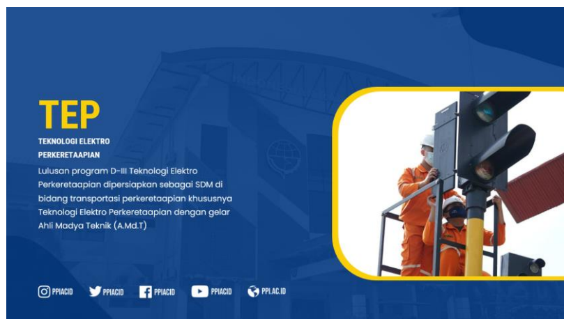
Gambar 7. Lulusan program D-III Teknologi Elektro Perkeretaapian

Selain itu, profil lulusan, pencapaian taruna setelah lulus, dan kontribusi alumni dalam pengembangan sektor transportasi juga disampaikan di paparan. Tujuannya untuk memberikan pemahaman yang jelas kepada siswa tentang peluang karir yang akan taruna miliki setelah menyelesaikan studi di Politeknik Perkeretaapian Indonesia Madiun. Narasumber juga memberikan informasi akreditasi dan kerja sama dengan stakeholder seperti industri perkeretaapian, pemerintah daerah, dan lembaga terkait lainnya. Hal ini menunjukkan komitmen Politeknik Perkeretaapian Indonesia Madiun untuk meningkatkan kualitas pendidikan dan terus berkolaborasi dengan industri perkeretaapian dan masyarakat di sekitarnya.