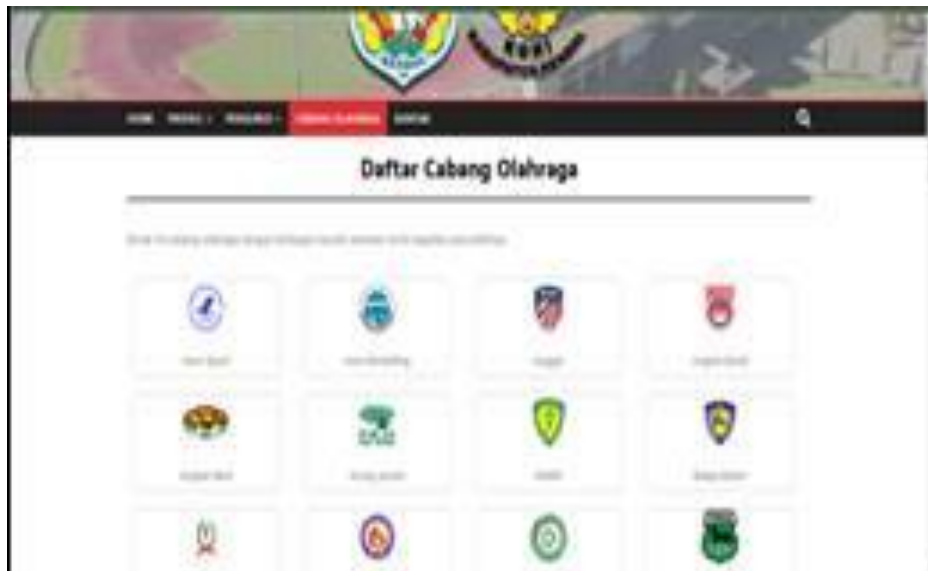
Gambar 5. Website berbasis wordpress KONI Kab. Kendal

Penerapan wordpress pada website KONI kab. Kendal telah terpenuhi sebagai gambar 5.