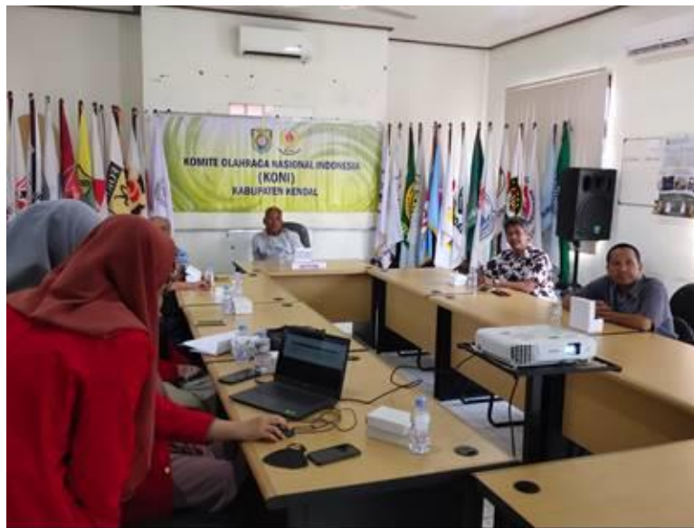
Gambar 3. Diskusi dan wawancara tentang permasalahan yang ada di KONI

Tim PKM akan melakukan perencanaan sesuai permasalahan yang diungkapkan mitra. Mitra akan mengikuti rencana program PKM secara aktif. Mitra dalam hal ini pengurus KONI Kab. Kendal yang diikutsertakan dalam kegiatan PKM ini. Mitra menggunakan sistem pembelajaran yang telah disusun oleh tim PKM sebagai acuan dan kerangka pembelajaran di KONI kab. Kendal. Mitra berperan aktif mengadakan konsultasi bila terjadi permasalahan yang tidak dapat dipecahkan oleh Mitra. Tim PKM akan berusaha semaksimal mungkin untuk aktif membantu pemecahan masalah yang dihadapi mitra. Oleh karenanya dilakukan diskusi dan wawancara dengan mitra untuk mengetahui permasalahan yang ada seperti gambar 3 berikut ini.