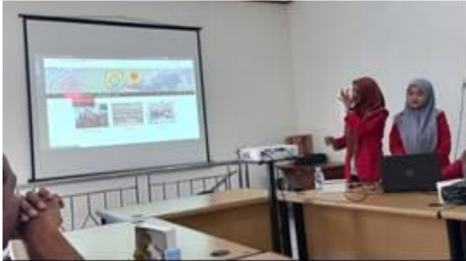
Gambar 6. Pelatihan Penerapan website

Dengan penerapan website ini, diharapkan :