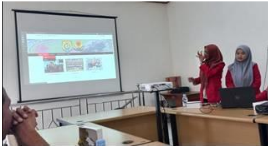
Gambar 4. Pemaparan Identifikasi Solusi

Pelaksanaan PKM ini akan dapat berhasil jika ada keterlibatan mitra. Tim PKM bekerja sama secara aktif dengan mitra sebagai pihak yang akan melaksanakan kegiatan bersama dengan tim PKM. Sebagai penerima pendampingan, mitra dapat berperan aktif selama pendampingan dengan mengikuti kegiatan dengan sungguh-sungguh dan berpikir secara kritis, jika ada hal-hal yang belum dipahami. Dalam Gambar 4 dipaparkan didentifikasi solusi.