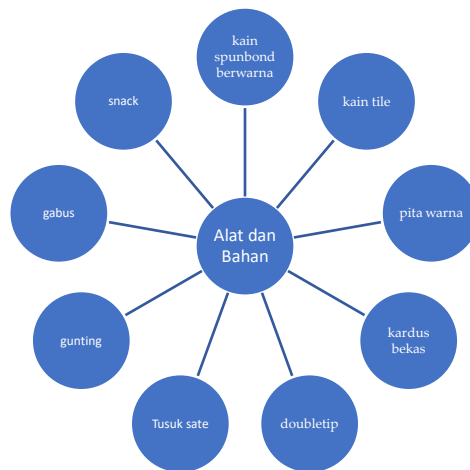
Gambar 2. Alat dan Bahan Pembuatan Buket

Pengabdian dilaksanakan pada Hari Minggu, 31 Maret 2024 bertempat di balai Desa Kaliputih yang dihadiri 35 peserta ibu anggota PKK Desa Kaliputih. Kegiatan pertama adalah memberikan materi tentang beberapa kreativitas, peluang usaha. Kemudian, peserta diajak untuk membuat buket snack, di mana mereka diperkenalkan dengan alat dan bahan yang digunakan. Alat dan bahan dijelaskan dalam Gambar 2.