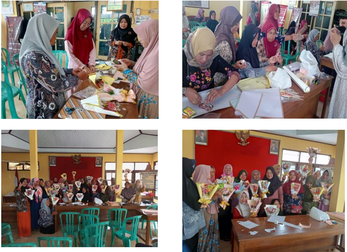
Gambar 4. Pelaksanaan pembuatan bucket

Pelaksanaan pelatihan bucket dapat dilihat pada Gambar 4.