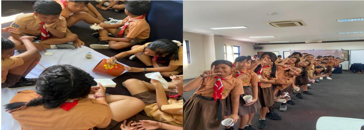
Gambar 4. Kegiatan melukis pada media pot dan pengumpulan sampah

Selain menyerahkan pupuk kompos, tong sampah dan plakat, mahasiswa program pertukaran merdeka melakukan kegiatan lomba melukis pot untuk melatih kreativitas pada anak-anak SD 02 & 05 Jineng dalam dan melakukan kuis memisahkan sampah yang bisa dijadikan pupuk kompos dan anorganik.