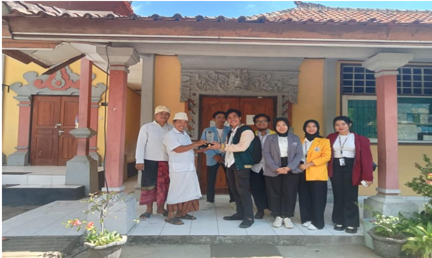
Gambar 3. Penyerahan plakat kepada kepala sekolah SD 05 Jineng Dalem