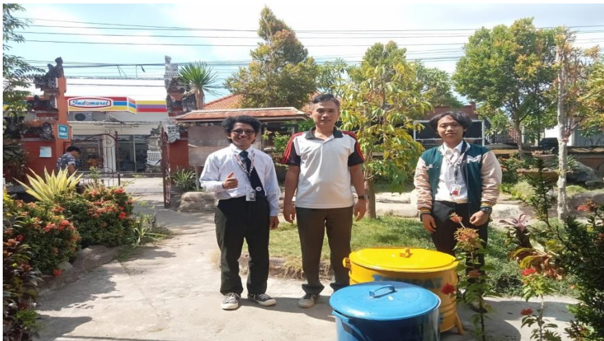
Gambar 2. Penyerahan tong sampah dan pupuk kepada SD 01 Jineng Dalem

Penyerahan pupuk kompos, tong sampah dan plakatke pihak sekolah merupaka wujud dari kepedulian pada lingkungan dan alam bahwa menjaga lingkungan sangatv penting untuk menjaga ekosistem dan keberlangsungan hewan dan tumbuhan