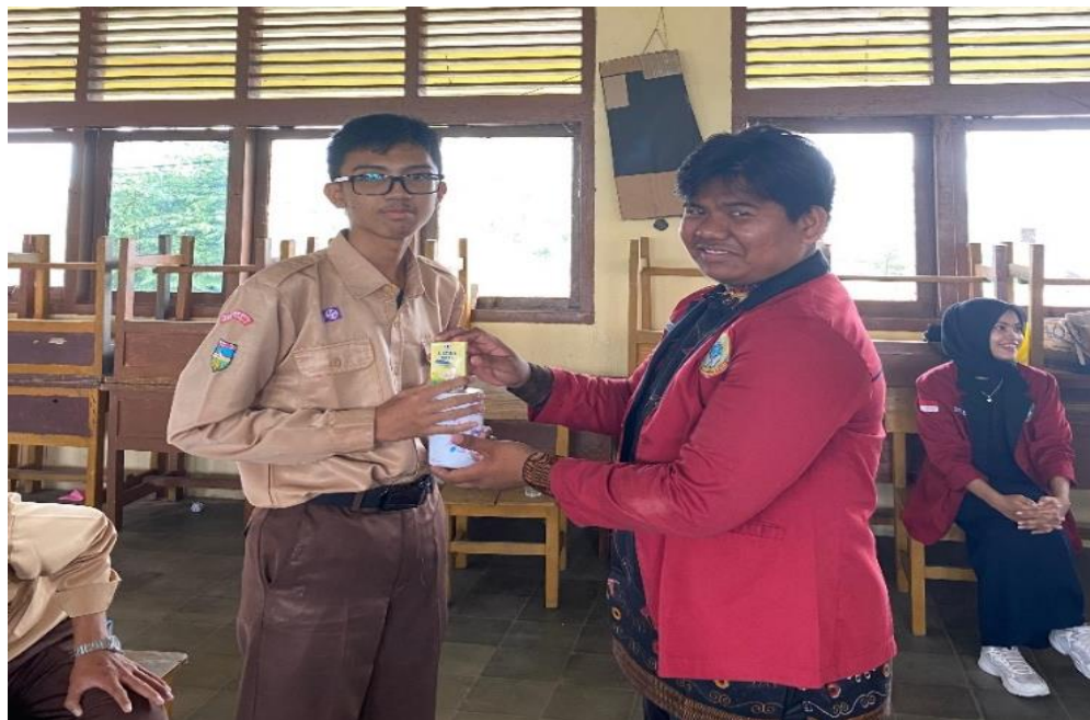
Gambar 4. Pembagian reward (hadiah) kepada siswa yang ikut pelatihan oleh Tim Pengabdian Kepada Masyarakat (PKM)