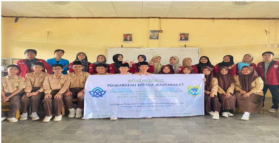
Gambar 6. Tim Pengabdian Kepada Masyarakat (PKM) Bersama siswa/siswi Madrasah Aliyah Laboratorium FTK UIN STS yang mengikuti kegiatan PKM

Adapun kendala yang dihadapi pada saat melakukan kegiatan pelatihan ini yaitu mencari tempat/ruangan pelatihan dan waktu dalam melaksanakan pertemuan, dikarenakan pada saat itu tepat pada persiapan pelaksanaan ujian semester bagi siswa siswi. Hal ini membuat tantangan bagi kami pelaksana