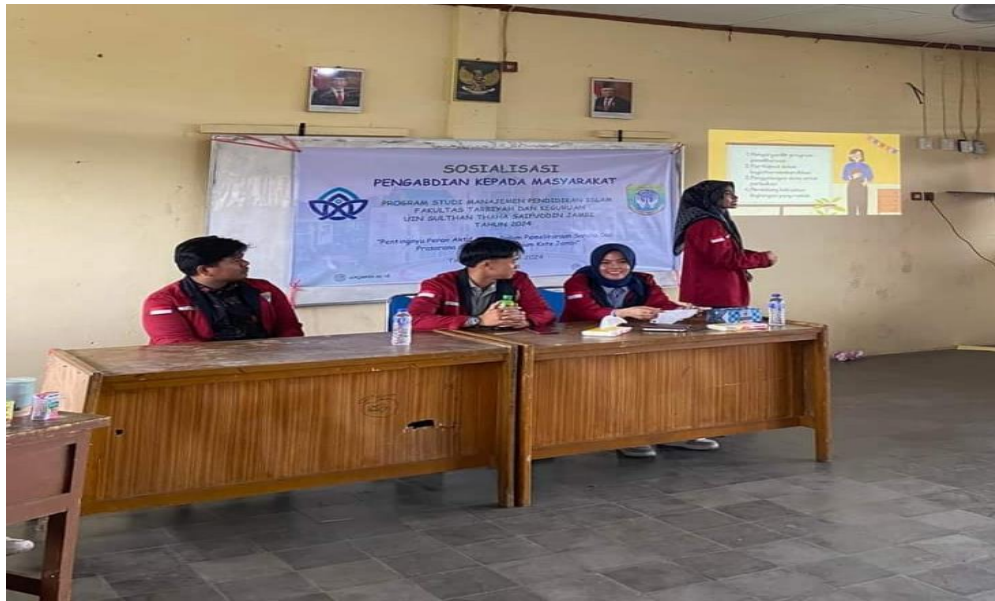
Gambar 3. Pelaksanaan Kegiatan Pelatihan oleh Tim Pengabdian Kepada Masyarakat (PKM)