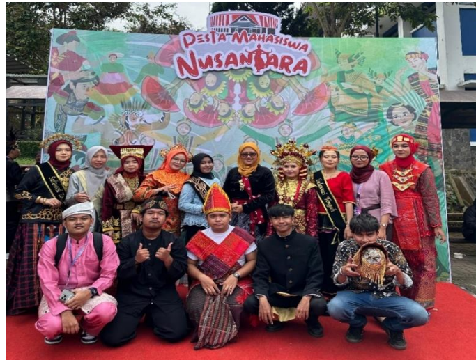
Gambar 2. Kegiatan festival budaya