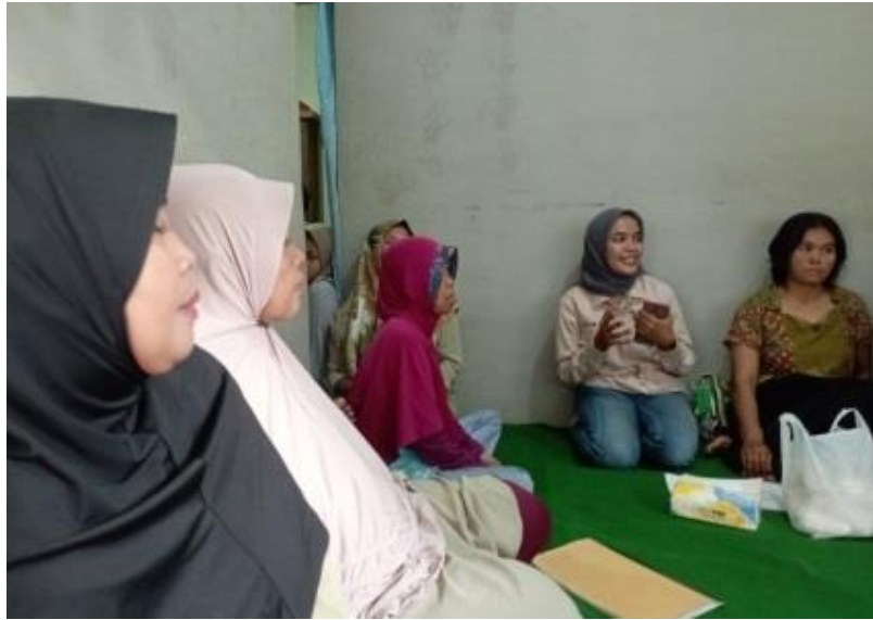
Gambar 3. Demonstrasi Aplikasi

Selanjutnya, peserta diajak untuk berdiskusi melalui kegiatan tanya jawab mengenai tantangan yang mungkin dihadapi dalam pengawasan penggunaan internet dan bagaimana mengatasinya. Diskusi ini memperkaya wawasan peserta melalui berbagi pengalaman dan strategi yang efektif dari sesama orang tua.