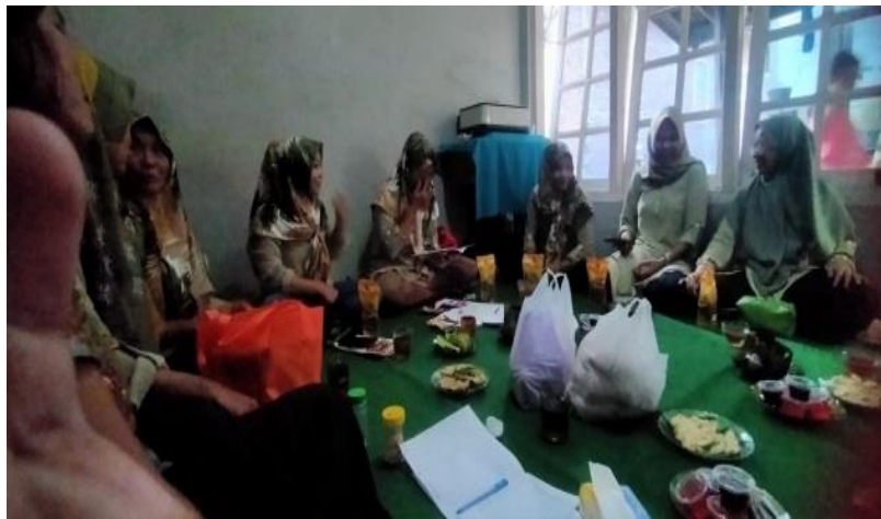
Gambar 4. Kegiatan Diskusi

Selanjutnya, peserta diajak untuk berdiskusi melalui kegiatan tanya jawab mengenai tantangan yang mungkin dihadapi dalam pengawasan penggunaan internet dan bagaimana mengatasinya. Diskusi ini memperkaya wawasan peserta melalui berbagi pengalaman dan strategi yang efektif dari sesama orang tua.