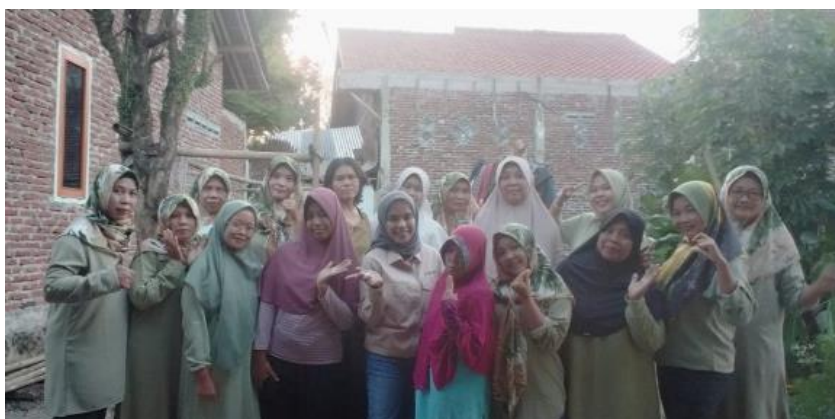
Gambar 6. Foto Bersama

Tidak lupa Dokumentasi kegiatan dilakukan dengan foto bersama untuk mencatat momen berharga dari kegiatan penyuluhan ini.