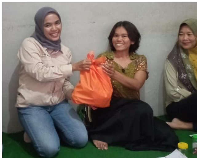
Gambar 5. Simbolis Penyerahan Bingkisan

Tidak lupa Dokumentasi kegiatan dilakukan dengan foto bersama untuk mencatat momen berharga dari kegiatan penyuluhan ini.