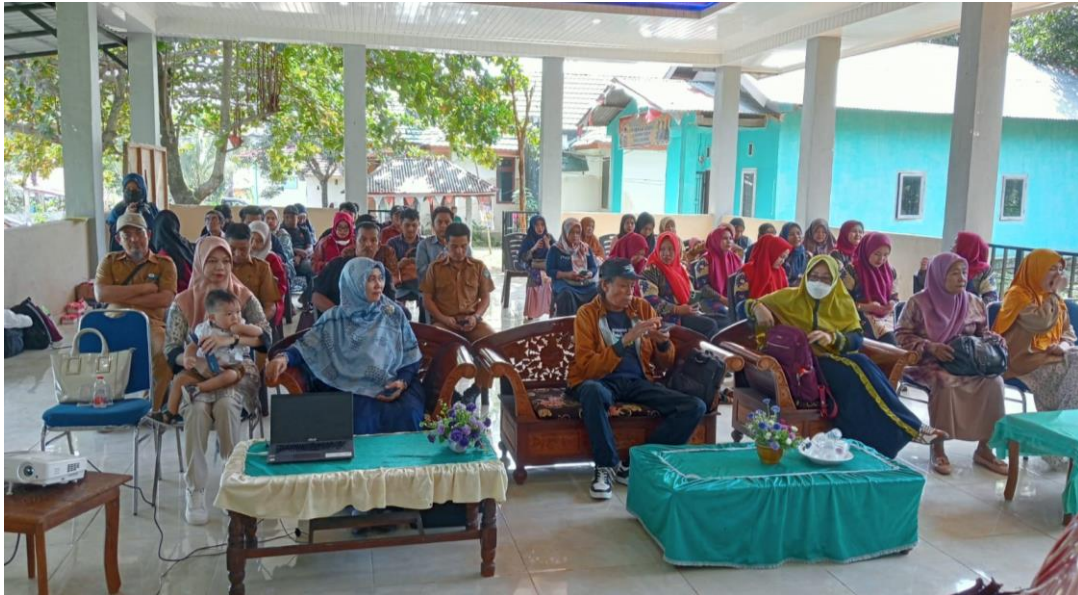
Gambar 6. Peserta dalam kegiatan persentase materi di Aula Kantor Desa Tanah Karaeng

membuat laporan keuangan salah satunya contoh tamplate laporan keuangan, rumus formula dan fungsi excel yang biasa digunakan dalam membuat laporan keuangan untuk mempermudah dalam proses perhitungan.