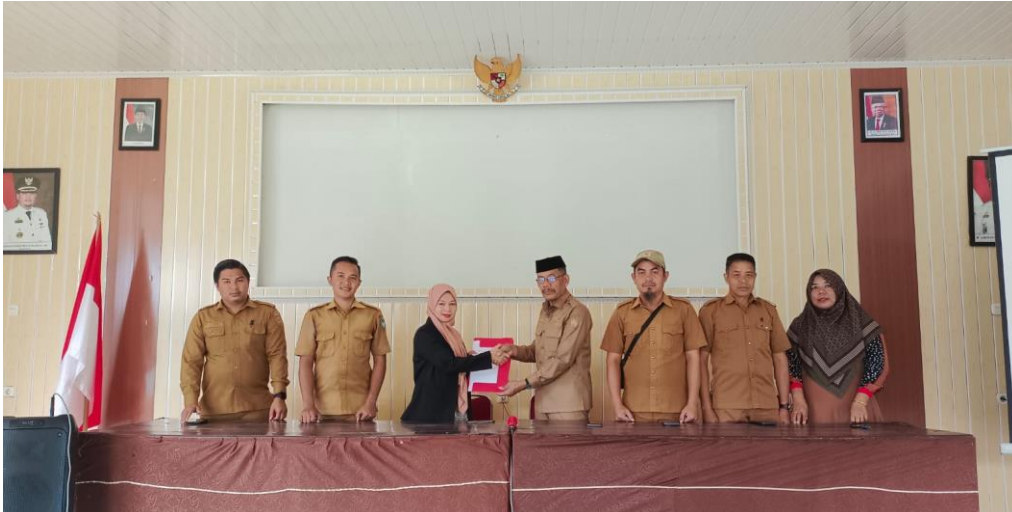
Gambar 2. Penandatanganan MOU Oleh TIM Pelaksana PKM dengan Kepala Desa Tanah Karaeng Kecamatan Manuju

Kegiatan pelatihan pembuatan laporan keuangan bagi aparat desa Tanah karaeng ini dilakukan didua tempat yaitu pertama pagi di aula kantor desa Tanah karaeng sebagai bentuk pendekatan teoritis dan kedua siang di café salabea desa Tanah karaeng kecamatan Manuju Kabupaten gowa dalam bentuk pendekatan praktik.