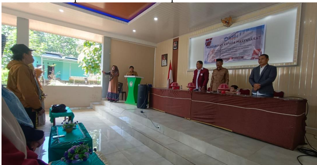
Gambar 3. Menyanyikan lagu Indonesia Raya Oleh Semua Peserta

Pertama kegiatan pelatihan ini dimulai pada pukul 08.30 yang dihadiri oleh aparat pemerintahan desa Tanah karaeng dalam hal ini Kepala desa tanah Karaeng , Sekretaris, Bendahara, Kasi dan Kaur desa Tanah Karaeng, Kepala Dusun, dan Tim Pelaksanan Kegiatan serta Tim Pengabdian Kepada Masyarakat dari Kampus Institut Teknologi dan Bisnis Bina Adinata dan Tim Pengabdian Kepada Masyarakat dari Kampus Universitas Patompo.