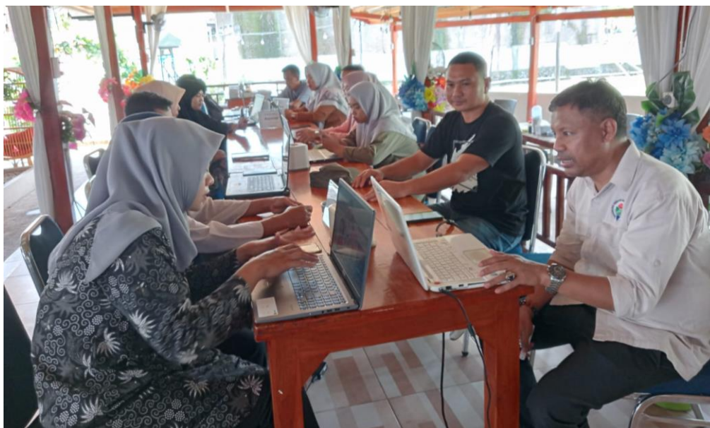
Gambar 7. Pendampingan pelatihan penyusunan laporan keuangan

Kegiatan latihan ini dilakukan dengan memberikan pelatihan secara individu kepada setiap peserta pelatihan yang didampingi oleh tim pelaksana kegiatan pengabdian masyarakat. Latihan ini berupa membuat laporan keuangan desa menggunakan Microsoft excel. Setelah selesai pendampingan, semua peserta diberi tugas untuk menyelesaikan sebuah laporan keuangan. Hal ini bertujuan untuk mengetahui sejauh mana tingkat keberhasilan pelatihan ini. Dengan pemahaman yang baik tentang prinsip laporan keuangan dan keahlian Excel, peserta membuat laporan yang akurat dan informatif setelah itu penutup dan kegiatan selesai.