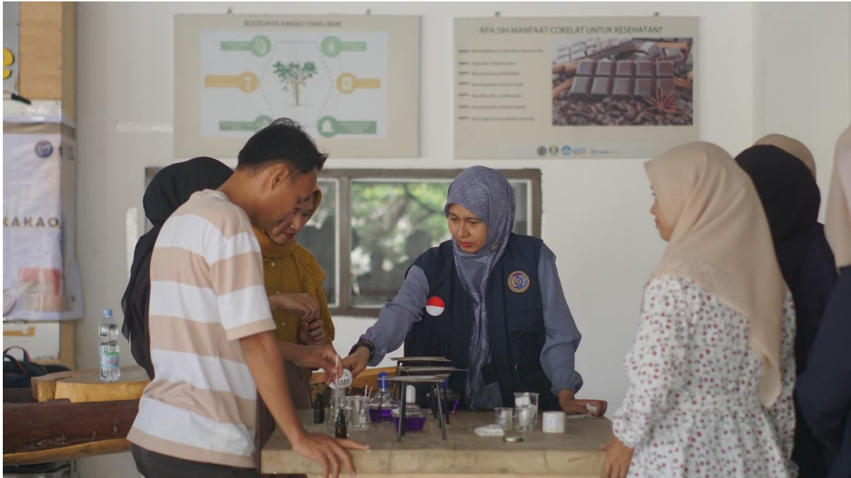
Gambar 3. Peserta praktek membuat produk aromaterapi

Luaran yang ditargetkan dalam kegiatan pelatihan dan praktek ini adalah peserta mampu membuat prototype produk lilin aromaterapi. Peserta mampu mengkombinasikan bahan sehingga membentuk produk yang siap untuk dikomersilkan. Hasil yang didapatkan menunjukkan bahwa peserta langsung terampil untuk membuat produk lilin aromaterapi (gambar 4).