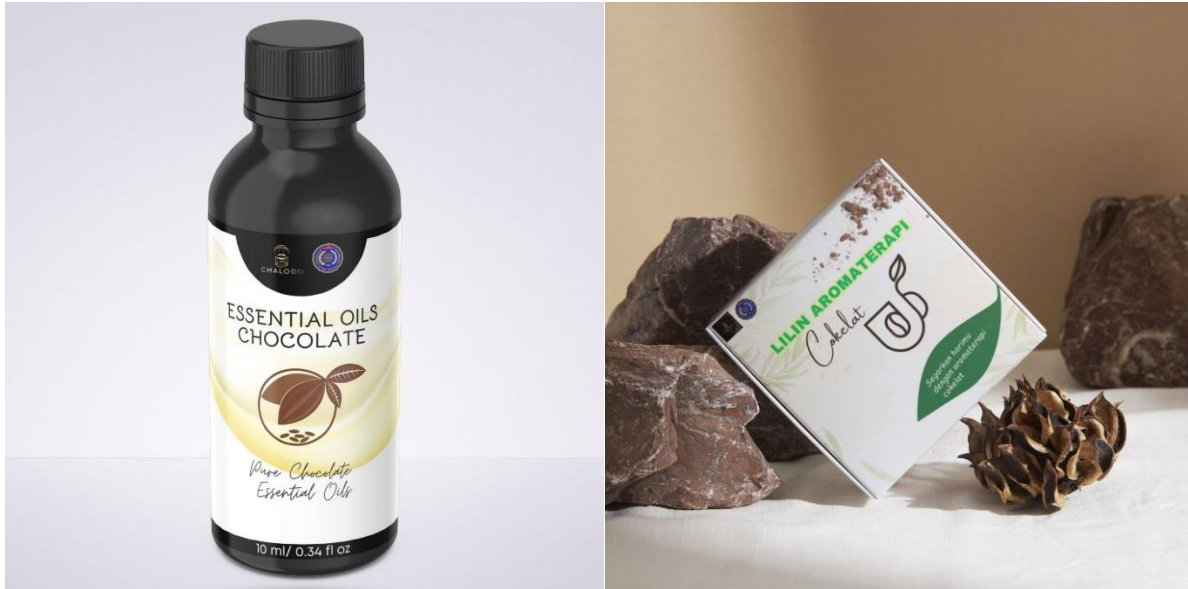
Gambar 6. Produk essential oils dan lilin aromaterapi cokelat yang dihasilkan