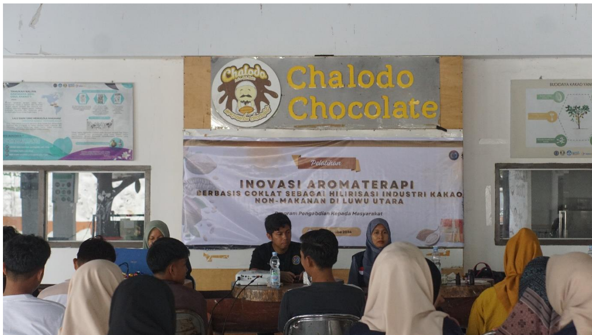
Gambar 2. Pemberian materi kepada peserta terkait minyak atsiri

Tahapan pelatihan dilakukan memberikan materi kepada mitra terkait teori aromaterapi. Materi yang diberikan dimulai dari bagaimana minyak atsiri dihasilkan sampai bagaimana menerapkan minyak atsiri ke dalam program aromaterapi, terutama dalam pembuatan lilin aromaterapi. Pelatihan dilakukan di Masamba, di aula Chalodo Sibali Resoe pada tanggal 7 September 2024. Teori terkait minyak atsiri ini digunakan sebagai penguatan awal untuk mengembangkan produk (gambar 2).