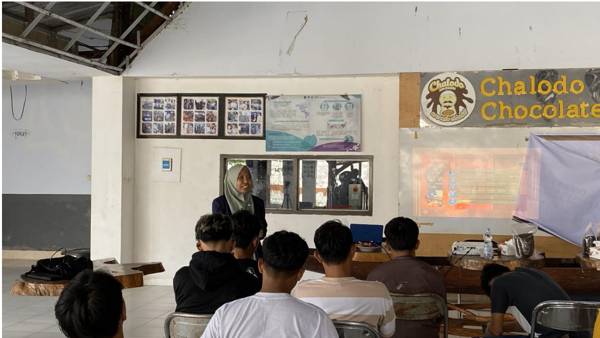
Gambar 5. Pelatihan digital marketing

Dalam rangka meningkatkan kemampuan mitra untuk memasarkan hasil produk yang telah dikembangkan, maka peserta diberikan juga materi terkait dengan digital marketing. Peserta diberikan pelatihan terkait dengan bagaimana memanfaatkan berbagai platform digital untuk pemasaran, seperti instagram, website dan marketplace. Hal ini sebagai upaya untuk meningkatkan pemasaran oleh mitra (gambar 5).