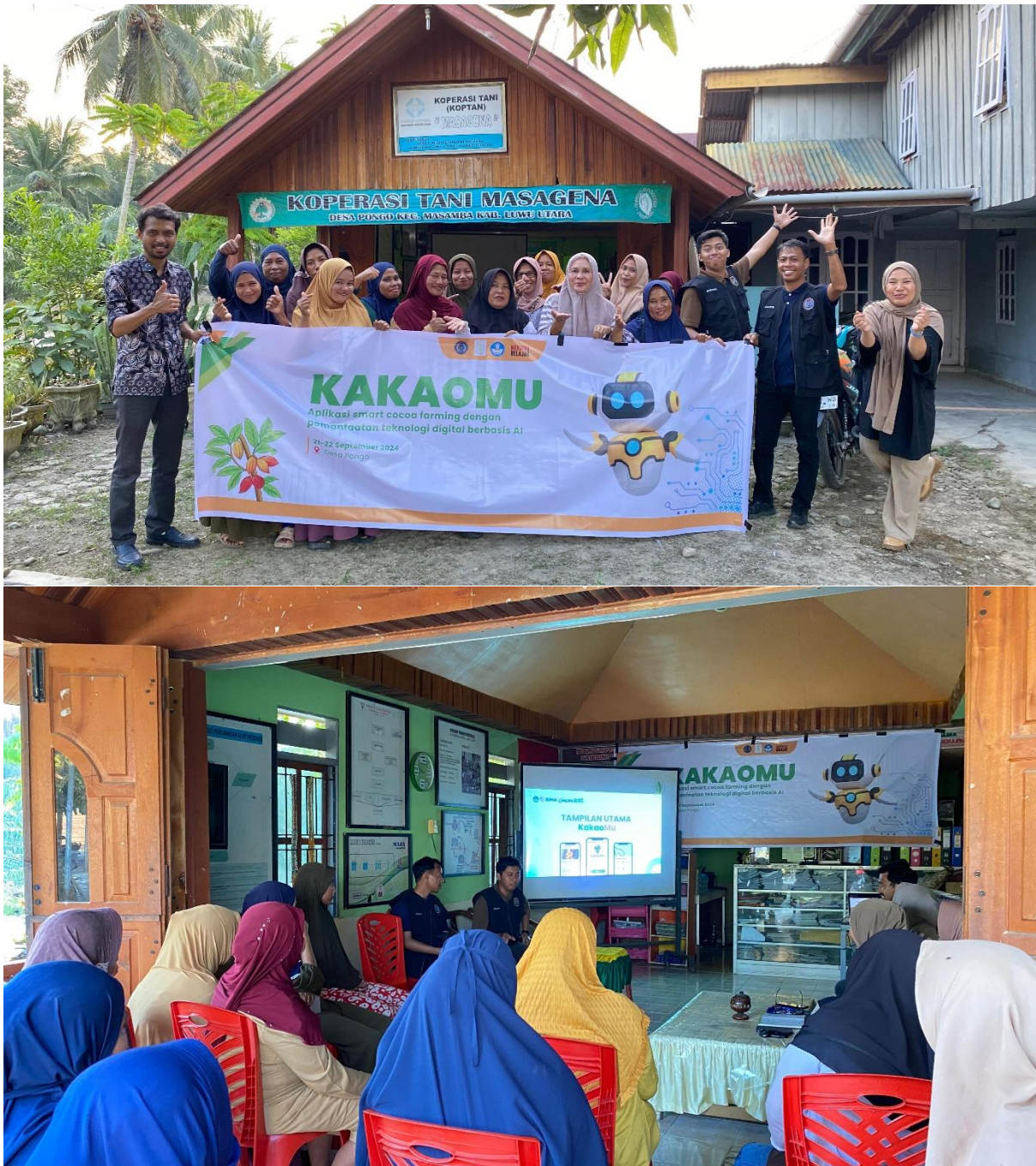
Gambar 4. Kegiatan pelatihan dan pendampingan penggunaan aplikasi KakaoMu