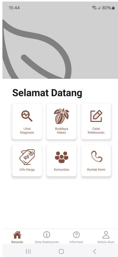
Gambar 3. Tampilan fitur KakaoMu