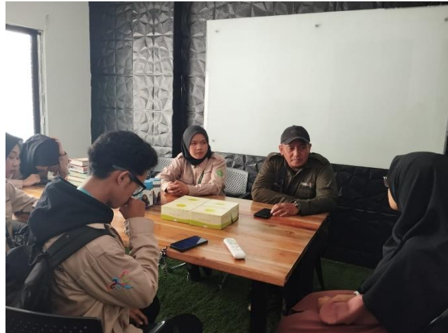
Gambar 3. Pelaksanaan Kegiatan