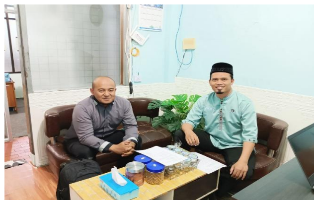
Gambar 2. Diskusi dengan Mitra Daarut