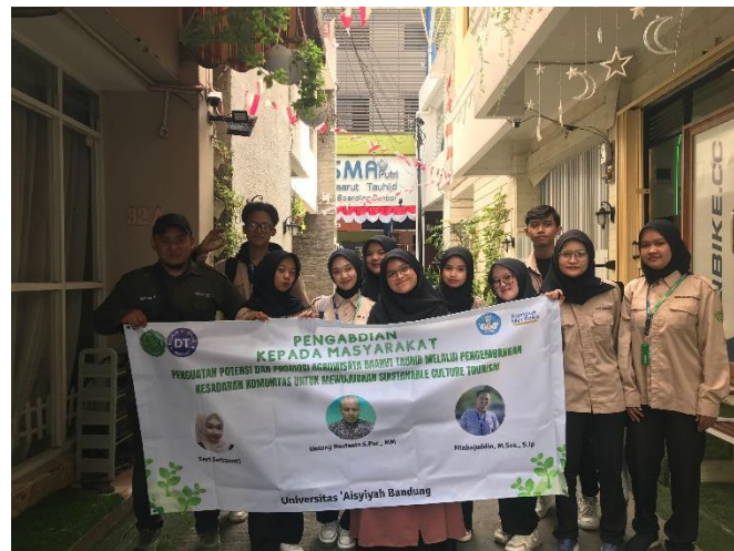
Gambar 4. Dokumentasi Kegiatan