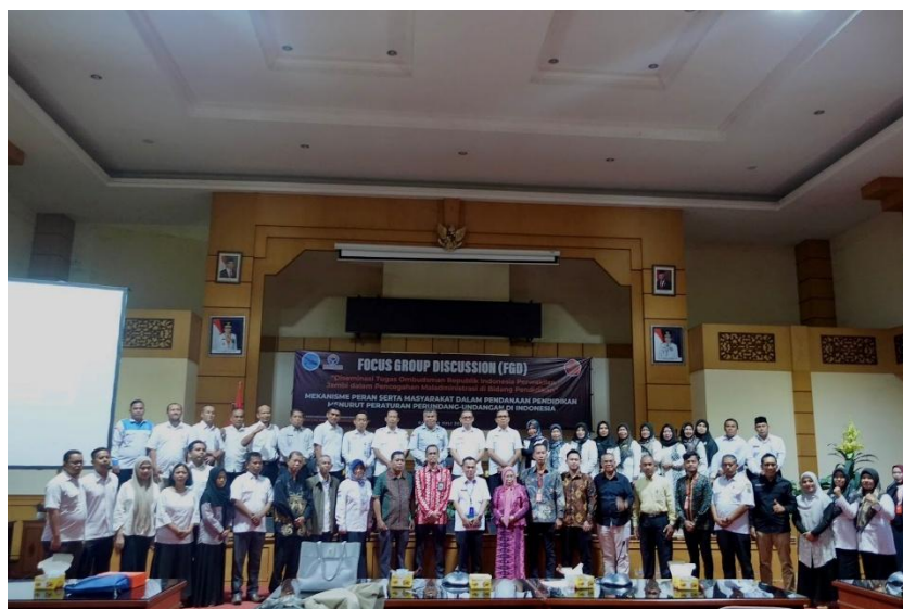
Gambar. 5 foto bersama tim PPM bersama Ombudsman, Dinas Pendidikan, Kepala Sekolah, Komite Sekolah