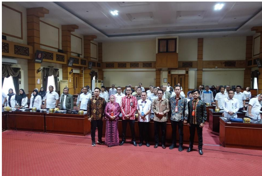
Gambar. 4 Tim PPM Bersama Peserta

Pemberdayaan masyarakat menjadi aspek penting lainnya dalam peran Ombudsman. Lembaga ini mendorong partisipasi aktif masyarakat dalam mengawasi praktik pungli di sekolah. Ombudsman memberikan pelatihan kepada kelompok-kelompok masyarakat tentang cara melakukan pengawasan dan pelaporan yang efektif. Selain itu, Ombudsman juga menyediakan perlindungan bagi pelapor kasus pungli, sehingga masyarakat merasa aman ketika melaporkan praktik-praktik ilegal yang mereka temui. Melalui serangkaian peran dan upaya tersebut, Ombudsman berusaha menciptakan ekosistem pendidikan yang bersih dari praktik pungutan liar. Tujuan akhirnya adalah untuk meningkatkan kualitas dan aksesibilitas pendidikan bagi seluruh masyarakat Indonesia, tanpa terbebani oleh biaya-biaya tambahan yang tidak semestinya. Dengan konsistensi dan kerjasama dari berbagai pihak, diharapkan praktik pungli di sektor pendidikan dapat ditekan seminimal mungkin, sehingga setiap anak Indonesia dapat menikmati hak pendidikannya tanpa hambatan finansial yang tidak perlu.