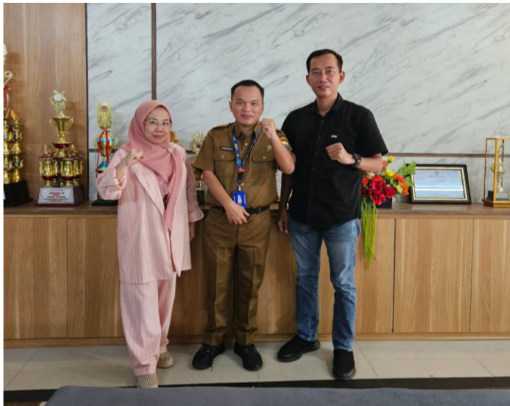
Gambar. 3 diskusi bersama Dinas Pendidikan Provinsi Jambi