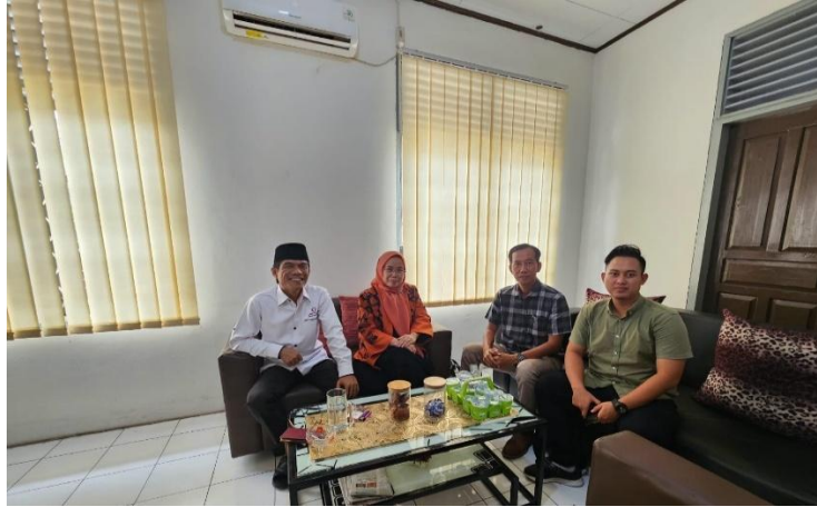
Gambar. 2 diskusi bersama Ombudsman Perwakilan Provinsi Jambi