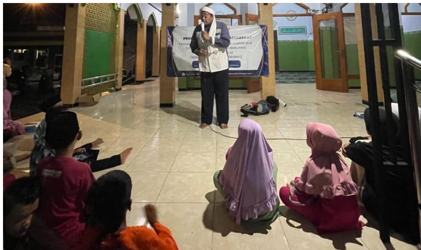
Gambar 4. Pemberian Materi BCM oleh Narasumber

Media pembelajaran interaktif, seperti aplikasi atau situs web pendidikan, memberikan kesempatan kepada siswa untuk belajar secara mandiri dan menyenangkan. Melalui media ini, siswa bisa mengakses konten edukatif, mengikuti kuis, atau bahkan berpartisipasi dalam forum diskusi. Integrasi teknologi dalam pembelajaran membantu menarik perhatian siswa dan meningkatkan minat mereka dalam materi yang diajarkan.