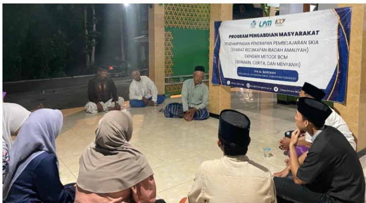
Gambar 2. Diksusi Program BCM dengan Takmir dan Pengajar

Pengajar menyanyikan bagian-bagian penting dari cerita dengan melibatkan siswa dalam menyanyi, baik sebagai paduan suara maupun dengan gerakan yang menyenangkan, suasana pembelajaran menjadi lebih hidup. Proses menyanyi ini tidak hanya membantu siswa mengingat pesan cerita, tetapi juga meningkatkan kepercayaan diri dan keterampilan sosial mereka.