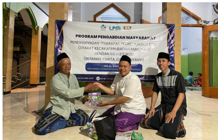
Gambar 3. Penyerahan Buku dan Bahan BCM

Penggunaan media audio visual, seperti video yang menampilkan cerita dan lagu, dapat memberikan pengalaman belajar yang lebih menarik. Siswa dapat melihat dan mendengar bagaimana cerita tersebut disampaikan dalam format yang dinamis. Hal ini dapat membantu siswa mengingat informasi lebih baik, karena mereka mendapatkan stimulasi visual dan auditori sekaligus. Media ini juga bisa digunakan untuk memicu diskusi dan refleksi setelah pemutaran.