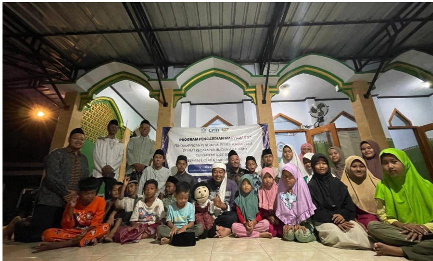
Gambar 5. Bersama Takmir, Pengajar, dan Siswa TPA Masjid Al Barokah