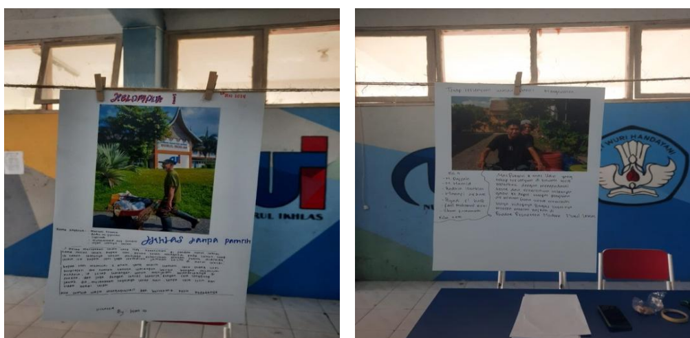
Gambar 3. Hasil dari karya fotografi human interest yang ditampilkan di selasar SMAExcellent Nurul Ikhlas

Siswa melakukan proses editing , evaluasi dan melakukan refleksi sebelum karya fotografi dipamerkan. Proses editing dibantu mahasiswa dengan hanya mengoreksi pencahayaan. Proses evaluasi adalah hal yang penting, foto yang sudah diedit akan didiskusikan dengan sesama anggota kelompok, apakah layak atau tidak layak ketika dipamerkan, apakah ada yang kurang atau tidak sesuai. Selanjutnya akan dilakukan sebuah refleksi untuk perbaikan apabila diperlukan. Karya fotografi akan dibuatkan foto esai, Antropologi Visual tidak hanya memberikan padangan tentang fotografi dalam suatu penelitian tetapi bagaimana menuliskan sebuah esai pendek tentang karya fotografi yang telah dibuat. Selanjutnya, foto dan esai dipamerkan. Berikut adalah beberapa karya yang telah dibuat.