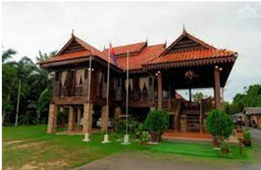
Gambar 1. Muzium Rumah Bugis-Pontian

Menyiapkan tempat dan fasilitas : Tempat yang di gunakan dalam kegiatan pelatihan ini adalah Muzium Rumah Bugis yang bertempat di daerah Pontian-Johor Bahru.