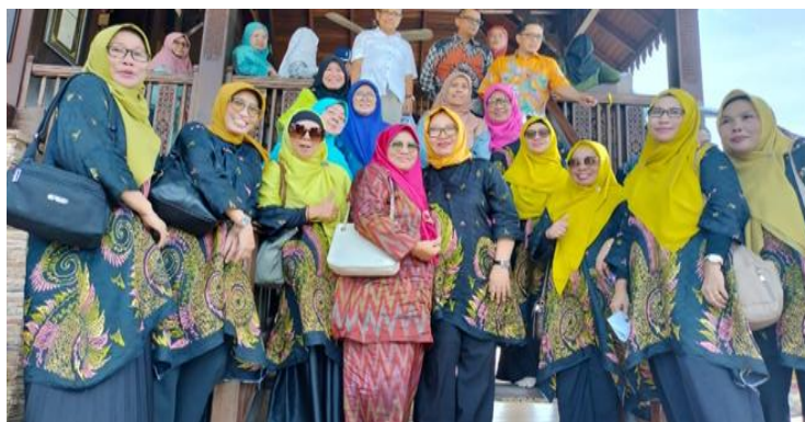
Gambar 2. Tim Pelaksana kegiatan

Kegiatan ini di hadiri 35 orang masyarakat bugis yang berada di wilayah Pontian Johor , Malaysia. Dari kegiatan ini di harapkan masyarakat keturunan bugis dapat mengenal huruf Lontara Bugis dan dapat memahami dan mempraktekkan bahasa bugis.