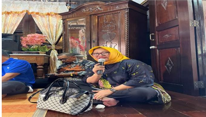
Gambar 3. Salah satu tim pemateri

Huruf Lontara, juga dikenal sebagai aksara Bugis, adalah salah satu warisan budaya tulis yang sangat berharga dari masyarakat Bugis dan Makassar di Sulawesi Selatan. Aksara ini tidak hanya berfungsi sebagai alat komunikasi tertulis, tetapi juga mencerminkan identitas dan sejarah panjang kedua suku tersebut.