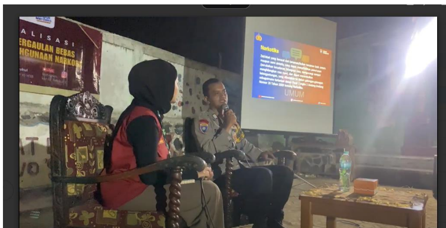
Gambar 7. Narasumber sedang Pemaparan Materi

Namun, ada beberapa hambatan yang perlu diperhatikan dalam upaya pemberantasan penyalahgunaan narkoba dan pergaulan bebas di Desa Batukarut. Salah satunya adalah keterbatasan akses informasi yang dialami oleh masyarakat pedesaan, yang membuat mereka sulit untuk mendapatkan edukasi secara mandiri. Selain itu, pengaruh lingkungan dan kurangnya pengawasan dari orang tua juga menjadi salah satu faktor yang mempengaruhi terjadinya pergaulan bebas dan penggunaan narkoba di kalangan remaja.