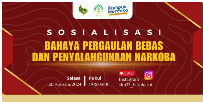
Gambar 5. Banner kegiatan Edukasi & Sosialisasi Narkoba dan pergaulan bebas di Kedusunan 2

Respon Masyarakat terhadap sosialisasi penyuluhan penyalahgunaan narkoba positif. Banyak warga, terutama orang tua dan remaja, menunjukkan ketertarikan untuk lebih memahami bagaimana cara mencegah penyalahgunaan narkoba dan pergaulan bebas di lingkungan mereka. Diskusi yang dilakukan setelah penyuluhan menunjukkan adanya keinginan warga untuk lebih waspada dan terlibat aktif dalam menjaga remaja dari bahaya pergaulan bebas dan penyalahgunaan zat terlarang. Hal ini ditunjukkan dari interaksi langsung antara masyarakat dan narasumber serta pertanyaan-pertanyaan kritis yang diajukan seputar upaya pencegahan dan rehabilitasi bagi pengguna narkoba.