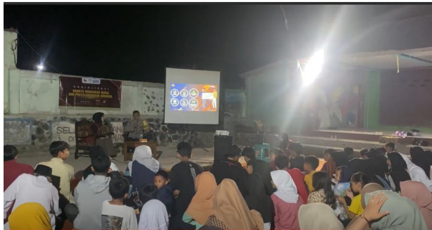
Gambar 8. Sosialisasi dan tanya jawab tentang bahaya narkoba Dan Pergaulan Bebas

Dari Polresta Kab, Bandung dan Dosen ahli UNINUS sebagai pemateri (input) tentang sosialisasi Penyalahgunaan Narkoba dan Pergaulan Bebas. Pemaparan materi dilakukan di lingkungan balai RW 05 pada jam 20.00-10.00 Pm. Menurut Polresta kedepannya harus saling membantu dan selalu menyebarkan pengetahuan baik ilmu maupun agama.