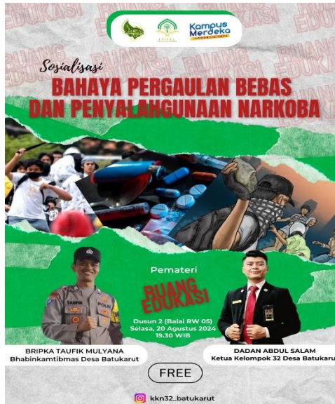
Gambar 6. Flyer Sosialisasi PKM

Tantangan Upaya Pemberantasan Pergaulan Bebas dan Penyalahgunaan Narkoba.