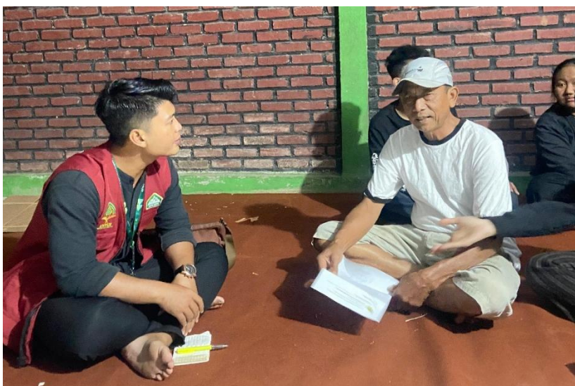
Gambar 3. Observasi Subyek pengabdian

Berdasarkan kegiatan sosialisasi yang dilakukan di Dusun 2 Kp. Sirnasari RT 02 RW 05 Desa Batukarut, Banyak warga, terutama remaja, yang belum sepenuhnya memahami risiko dan dampak jangka panjang dari perilaku ini, baik dalam aspek kesehatan fisik maupun mental, serta dampaknya terhadap hubungan sosial dan ekonomi. Sosialisasi yang menggunakan materi presentasi dan video pendek terbukti lebih efektif dalam menarik perhatian masyarakat. Kegiatan ini juga melibatkan Polresta Bandung dan KKN Uninus, yang menekankan pentingnya kerjasama komunitas dan pendidikan agama dalam mencegah perilaku menyimpang. Pengetahuan yang diberikan mampu membuka wawasan masyarakat tentang ancaman narkoba, seperti risiko ketergantungan, penyakit menular seksual, dan kriminalitas yang sering menyertai pergaulan bebas.