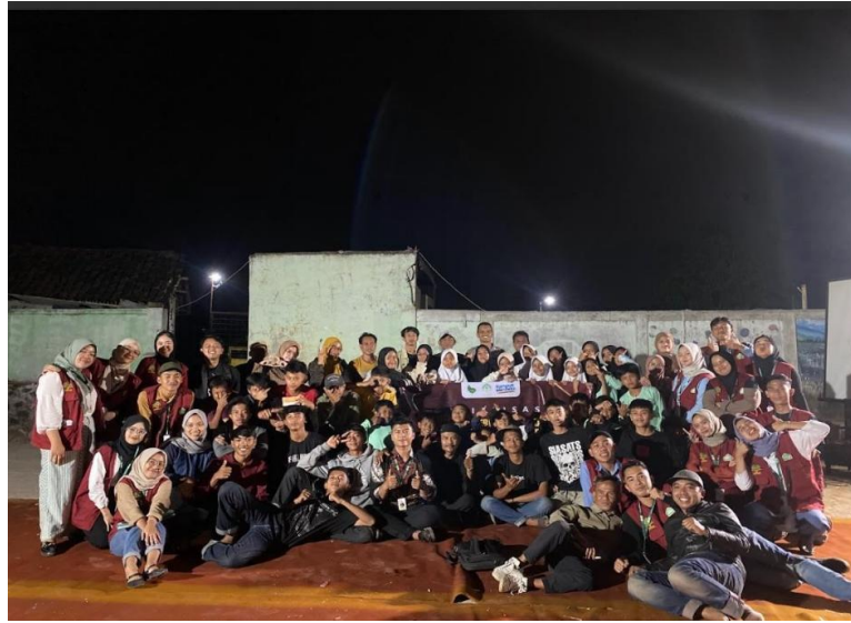
Gambar 9. Sosialisasi dan tanya jawab pasca pelatihan