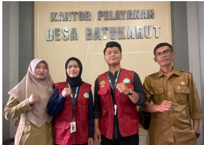
Gambar 4. Penyusunan rancangan program Bersama pihak Perangkat Desa

Respon Masyarakat terhadap sosialisasi penyuluhan penyalahgunaan narkoba positif. Banyak warga, terutama orang tua dan remaja, menunjukkan ketertarikan untuk lebih memahami bagaimana cara mencegah penyalahgunaan narkoba dan pergaulan bebas di lingkungan mereka. Diskusi yang dilakukan setelah penyuluhan menunjukkan adanya keinginan warga untuk lebih waspada dan terlibat aktif dalam menjaga remaja dari bahaya pergaulan bebas dan penyalahgunaan zat terlarang. Hal ini ditunjukkan dari interaksi langsung antara masyarakat dan narasumber serta pertanyaan-pertanyaan kritis yang diajukan seputar upaya pencegahan dan rehabilitasi bagi pengguna narkoba.