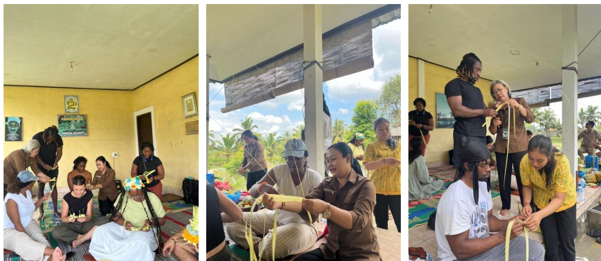
Gambar 3. Sesi praktik membuat Canang Sari

Pada sesi praktik pembuatan kreasi janur, peserta memperoleh keterampilan langsung dalam melipat, menoreh, dan merangkai janur menjadi bentuk canang sari yang estetik dan bermakna mendalam. Selain menyampaikan tentang teknik dasar, peserta juga diperkenalkan pada variasi bentuk canang sari dan kreasi janur lainnya, termasuk yang digunakan dalam upacara keagamaan serta yang dikembangkan sebagai elemen dekoratif dalam pariwisata. Dengan demikian, peserta tidak hanya memahami nilai spiritual yang ada pada canang sari , tetapi juga mendapat wawasan lain mengenai pemanfaatan janur sebagai sarana dekorasi.