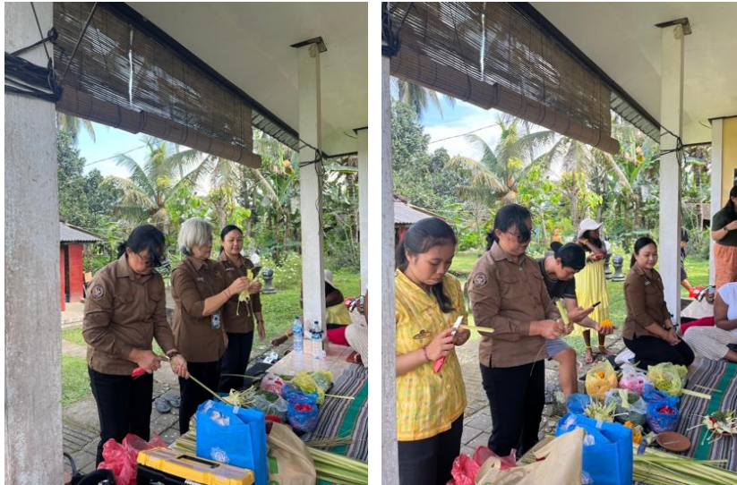
Gambar 2. Pemaparan Materi tentang Filosofi dan Makna Canang Sari

Pada sesi praktik pembuatan kreasi janur, peserta memperoleh keterampilan langsung dalam melipat, menoreh, dan merangkai janur menjadi bentuk canang sari yang estetik dan bermakna mendalam. Selain menyampaikan tentang teknik dasar, peserta juga diperkenalkan pada variasi bentuk canang sari dan kreasi janur lainnya, termasuk yang digunakan dalam upacara keagamaan serta yang dikembangkan sebagai elemen dekoratif dalam pariwisata. Dengan demikian, peserta tidak hanya memahami nilai spiritual yang ada pada canang sari , tetapi juga mendapat wawasan lain mengenai pemanfaatan janur sebagai sarana dekorasi.