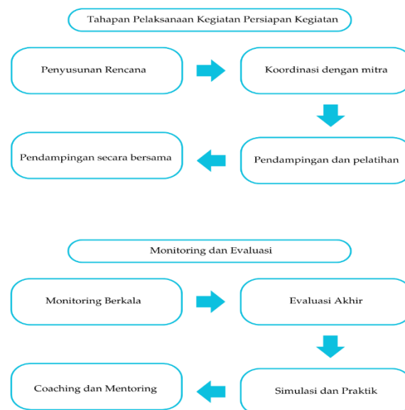
Figure 1. Proses Tahapan Kegiatan Pelatihan

Metode pelaksanaan yang di pakai untuk pelatihan Guru Madrasah Ibtidaiyah di ngawi jawa timur adalah Metode Pendampingan dan Mentoring. Metode kegiatan pengabdian dalam program pelatihan Pendidikan Guru ini dirancang untuk memberikan dampak yang signifikan pada peningkatan kompetensi guru dan penerapan kebijakan dalam Belajar. identifikasi kebutuhan meliputi kegiatan melakukan identifikasi kebutuhan dan tantangan yang dihadapi oleh seorang Guru melalui survei awal. Berikut adalah uraian detail mengenai metode kegiatan pengabdian yang dilakukan.