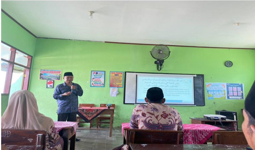
Figure 2. Proses Pelatihan Guru.