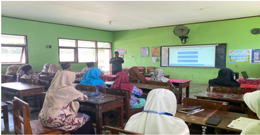
Figure 3. Proses Pelatihan Guru.