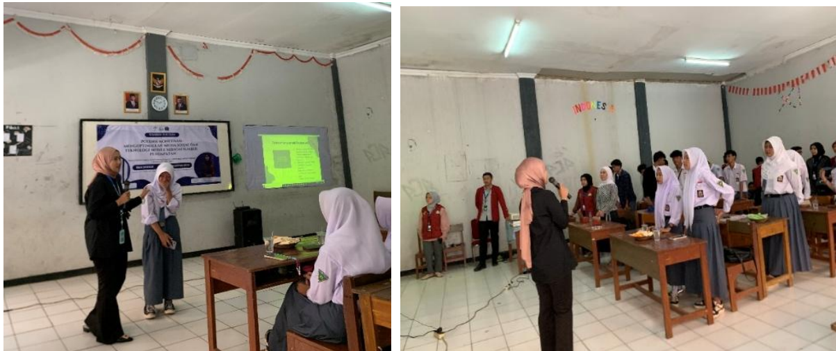
Gambar 3. Penjelasan Studi Kasus Oleh Narasumber Kedua

Salah satu hal yang diidentifikasi dalam sesi ini adalah pentingnya memberikan dukungan lebih lanjut kepada siswa yang sudah memiliki ide atau bahkan mulai memonetisasi media sosial mereka. Beberapa siswa telah memiliki pengalaman menjual produk melalui Instagram, dan ada yang ingin mengembangkan akun YouTube mereka. Narasumber menyarankan adanya pembimbingan atau pendampingan lebih lanjut agar siswa dapat lebih mudah mengatasi tantangan dalam membangun penghasilan yang berkelanjutan dan memperluas peluang bisnis mereka melalui media sosial.