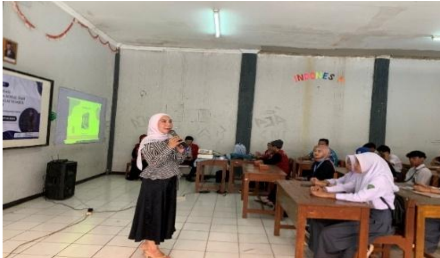
Gambar 2. Penjelasan Materi oleh Narasumber Pertama