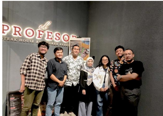
Gambar 2. Bukti Lokakarya di T-Space Bintaro

Praktik ethnic profiling tidak hanya gagal dalam perspektif etika, tetapi juga bertentangan dengan semangat hukum HAM internasional yang menjamin keadilan dan kesetaraan bagi semua orang, tanpa pengecualian. Berdasarkan penjelasan tersebut, peneliti melakukan quisioner untuk memetakan pemikiran responden, sebagai berikut: