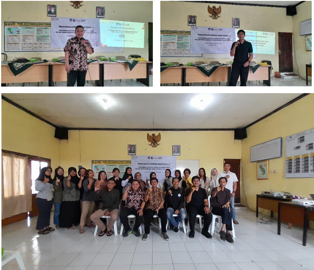
Gambar 3. Pelaksanaan Pengabdian Masyarakat

Program pengabdian kepada masyarakat terkait peningkatan daya saing ekonomi desa dalam mewujudkan desa unggul dan inovatif di Kelurahan Bandungan yang sudah dilaksanakan dapat memberikan pengetahuan, keterampilan dan motivasi bagi para peserta, pemberdayaan ekonomi desa semakin optimal dan inovasi daya saing ekonomi desa berkembang secara inovatif dan unggul di masa akan datang.