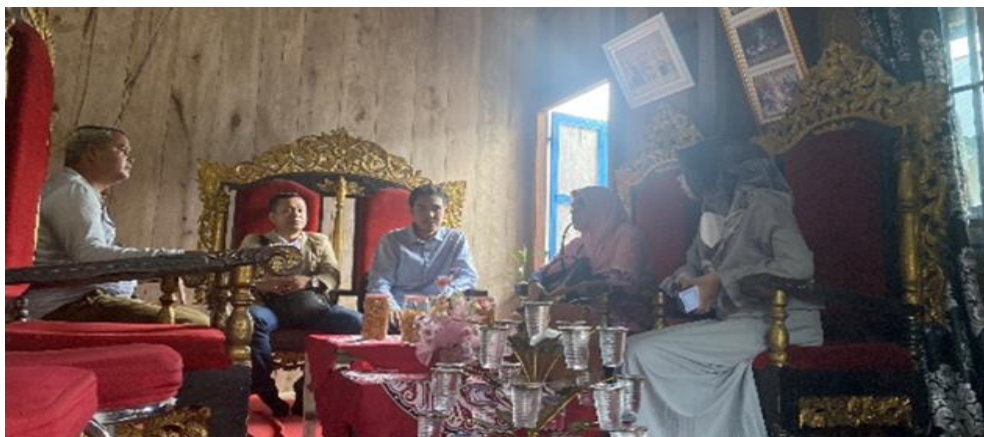
Gambar 2. Pertemuan Pertama

Kegiatan dilaksanakan sebanyak 5 kali pertemuan yang dimulai sejak pertemuan pertama tanggal 2 September 2022. Dalam pelaksanaan kegiatan tim yang terdiri atas empat dosen dan beberapa mahasiswa mengunjungi Kepala Desa Ulak banding untuk melakukan diskusi awal dan observasi langsung terhadap desa Ulak Banding.