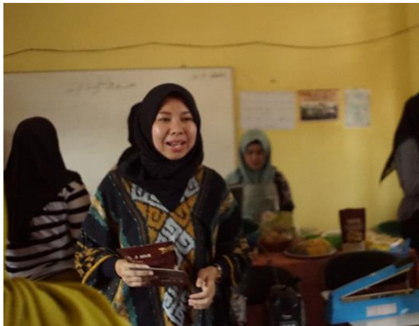
Gambar 4. Penyampaian Materi

Pertemuan keempat pada tanggal 4 Oktober 2022 telah hadir 3 orang dosen, 6 mahasiswa dan 25 orang peserta pengabdian. Tim memberikan penjelasan mengenai pentingnya kualitas produk dan desain produk yang dijualkan (Purwaningsih et al., 2019). Bagaimana kemasan dan kepercayaan konsumen berperan penting dalam meningkatkan daya saing usaha kepada para peserta yang terdiri dari Ibu-Ibu PKK sehingga UMKM yang mereka miliki dapat berkembang dan mensejahterakan kehidupan mereka.