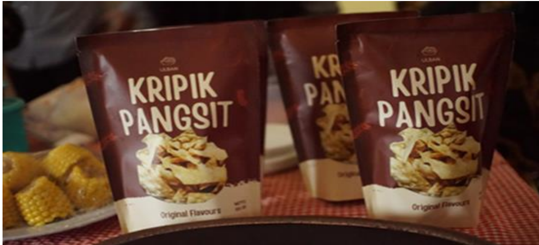
Gambar 7. Produk Inovasi yang Dihasilkan

Secara umum, kemasan harus berguna, mudah diidentifikasi, menyampaikan manfaat atau kegunaan, memiliki label yang jelas sesuai dengan persyaratan pelabelan dan periklanan, efisien, menarik serta menawarkan kenyamanan (Suryati & Salkiah, 2019). Oleh karena itu perlunya terobosan atau inovasi dalam peningkatan kualitas kemasan terutama pada produk UMKM. Gambar 6 menunjukkan hasil kemasan yang diperkenalkan kepada masyarakat di Desa Ulak Bandung. Kemasan yang baik tentunya akan menarik perhatian dan minat konsumen serta memudahkan para pelaku usaha dalam penyertaan sertifikasi produk dari dinas kesehatan serta adanya label halal MUI. Penelitian yang dilakukan oleh (Lukman & Dirgahadi, 2014) menunjukkan hasil penelitian bahwa faktor-faktor ekuitas merek berpengaruh secara signifikan terhadap keputusan pembelian dan kepuasan konsumen produk Teh Botol Sosro kategori kemasan kotak di kota Bandung. Selain itu penelitian dengan judul penelitian "Pentingnya Kemasan Terhadap Penjualan Produk Perusahaan" oleh (Apriyanti, 2018) membuktikan bahwa tampilan kemasan yang sangat menarik bagi konsumen akan meningkatkan penjualan produk perusahaan.