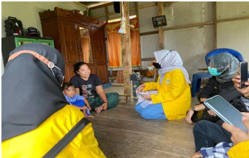
Gambar 3. Wawancara Masyarakat pada Pertemuan ke-3

Berdasarkan hasil wawancara pada Gambar 2, Desa Ulak Banding masih sangat potensial untuk dikembangkan. Hasil tersebut didasari ada letak desa cukup dekat dengan pasar indralaya dan perlu adanya peningkatan kualitas produk dari segi kemasan dan label legalitas.