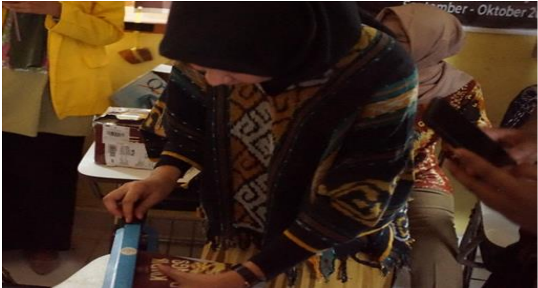
Gambar 5. Demonstrasi Pengemasan Produk