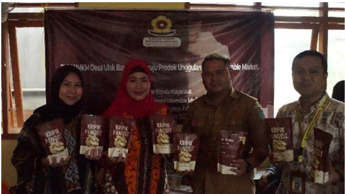
Gambar 6. Foto Bersama

Pertemuan terakhir dalam rangkaian kegiatan pengabdian ini dilaksanakan pada tanggal 5 Oktober 2022. Dalam pertemuan tersebut dilaksanakan pemberian evaluasi mengenai materi ajar yang telah disampaikan kepada para peserta untuk menguji apakah kegiatan yang dilakukan telah disampaikan dengan jelas dan memberikan pemahaman kepada para peserta dengan baik. Evaluasi dilaksanakan dengan pemberian soal-soal kepada para peserta terkait dengan materi ajar yang telah disampaikan sebelumnya yang kemudian peserta mengisi soal-soal tersebut dan selanjutnya akan dikoreksi dan diperoleh hasil bahwa peserta rata-rata menjawab soal-soal tersebut diatas 70%.