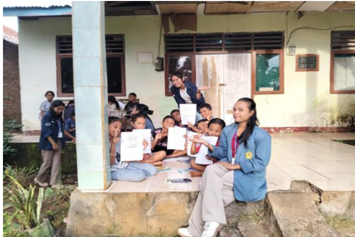
Gambar 4. Minggu Ke-Dua Melaksanakan Pojok Baca Pada tanggal 29 april 2025