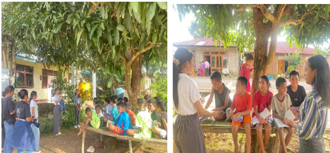
Gambar 3. Minggu pertama Melaksanakan Pojok Baca Pada tanggal 23 april 2025