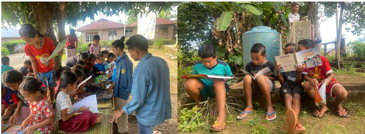
Gambar 5. Minggu Ke-Tiga Melaksanakan Pojok Membaca Pada Tanggal 4 Mei 2025