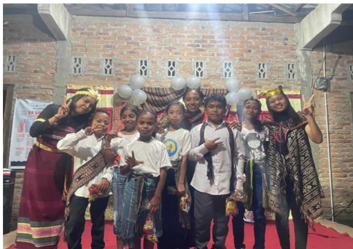
Gambar 6. Minggu Ke-Empat Melaksanakan Perlombaan Bersama Anak-Anak Pada Tanggal 2 Juni 2025