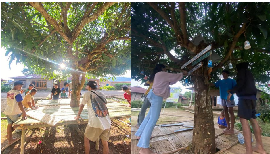
Gambar 1. Lokasi Pelaksanaan Kegiatan

Kegiatan ini diharapkan dapat memberikan kontribusi nyata dalam upaya penguatan pendidikan berbasis komunitas serta menjadi model praktik baik dalam literasi anak di daerah 3T (Tertinggal, Terdepan, dan Terluar).