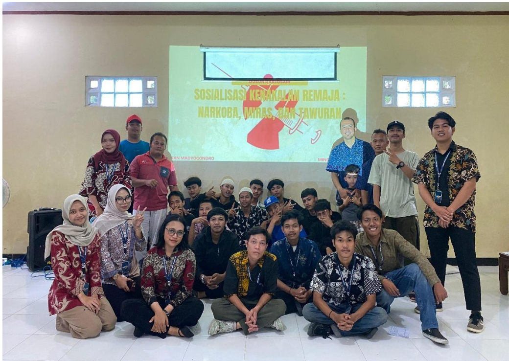
Gambar 3. Kegiatan Sosilaisasi

Hasil kegiatan sosialisasi menunjukkan tercapainya tujuan awal dengan peningkatan rata-rata ketepatan jawaban sebesar 3,25 poin persentase dari 94,98% menjadi 98,23%. Meskipun secara kuantitatif peningkatan ini tampak modest, namun signifikansi peningkatan tersebut perlu dipahami dalam konteks bahwa baseline pengetahuan peserta sudah cukup tinggi. Hal ini mengindikasikan bahwa remaja di Dusun Harjosari sebenarnya telah memiliki pengetahuan dasar yang baik tentang kenakalan remaja, namun memerlukan penguatan dan klarifikasi pada aspek-aspek tertentu.