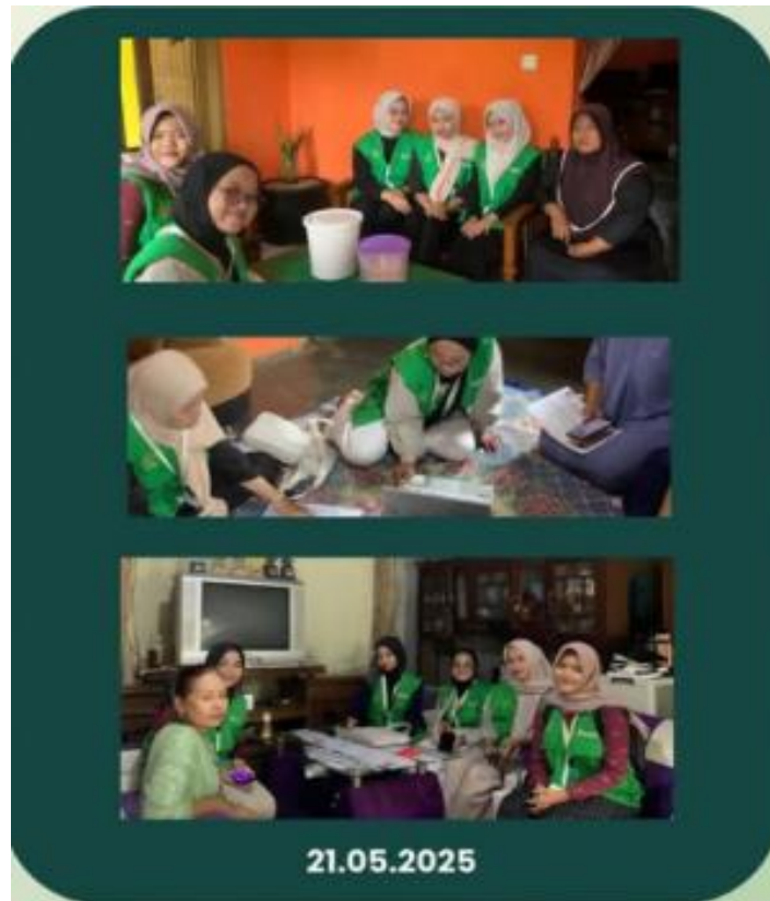
Gambar 3. Observasi dan Sosialisasi di UMKM Desa Cibulakan, Desa Pasirbiru