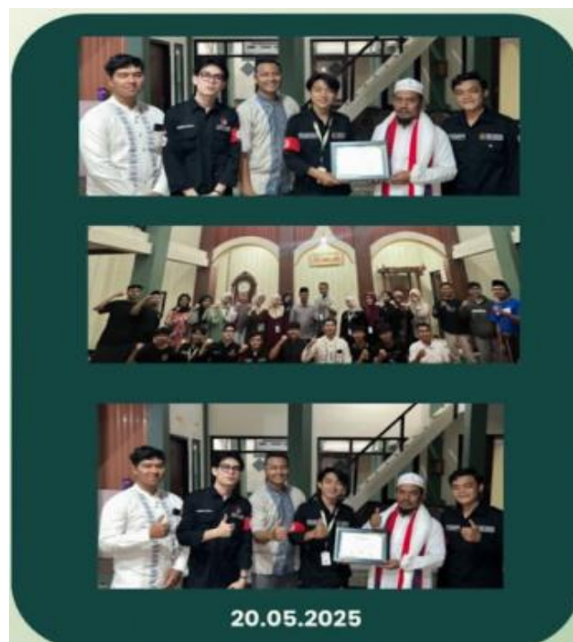
Gambar 2. Penyuluhan Hukum Pernikahan Dini di Masjid Al-Mubarakah, Dusun 1 RW 2

Kegiatan kedua diselenggarakan pada 20 Mei 2025 pukul 16.00 WIB di Masjid Jami Al-Mubarakah, Dusun 1 RW 2, dengan sasaran para orang tua. Pada sesi ini, kami menjelaskan pentingnya peran orang tua dalam mencegah pernikahan dini dan mendorong komunikasi yang terbuka dengan anak remaja mereka. Dengan edukasi berbasis empati dan data faktual, kami berharap para orang tua dapat menjadi pelindung dan pendamping yang baik dalam pertumbuhan anak-anak mereka.