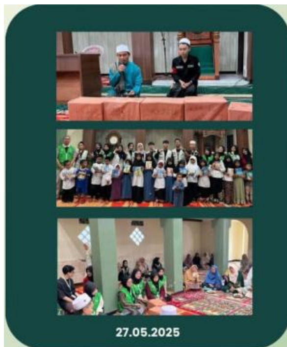
Gambar 4. Pendampingan Kajian Al Quran dan pendistribusian Al Quran di Masjid Al Mubarakah