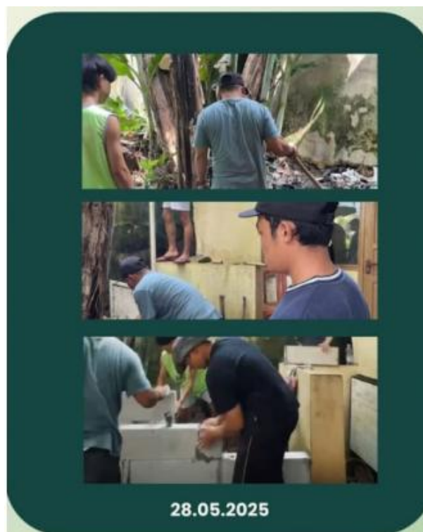
Gambar 5. pembuatan bak sampah pada kantor desa Pasirbiru dan sekitarnya