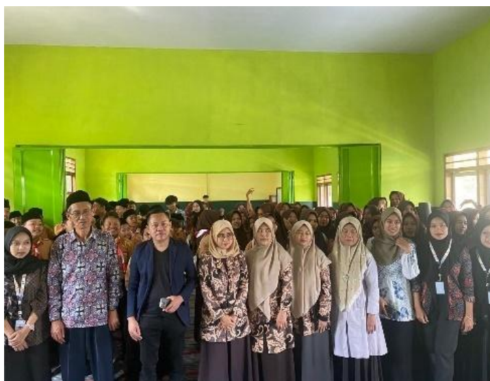
Gambar 4. Seminar kewirausahaan

Mengadakan pelatihan manajemen usaha untuk meningkatkan keterampilan pelaku UMKM di masa mendatang. Pelatihan ini dapat berupa memberikan seminar pelatihan membuat.