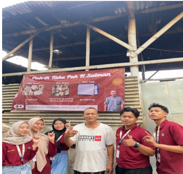
Gambar 6. Pemasangan banner produk tahu