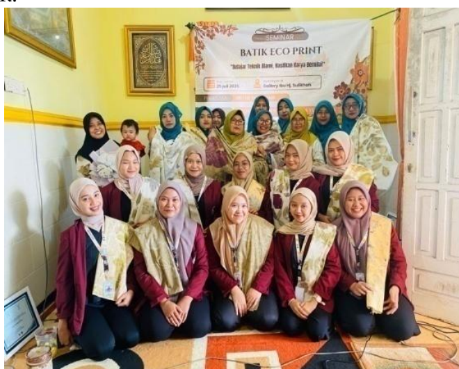
Gambar 5. Seminar membuat eco print

Mengadakan pelatihan manajemen usaha untuk meningkatkan keterampilan pelaku UMKM di masa mendatang. Pelatihan ini dapat berupa memberikan seminar pelatihan membuat.