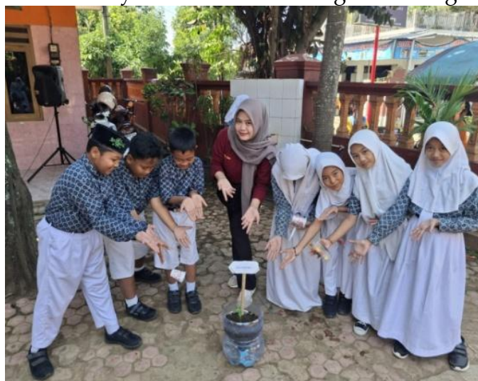
Gambar 3. Belajar bercocok tanam di sekolah

Program ini bertujuan untuk memberikan pemahaman tentang pertanian modern dan keberlanjutan kepada siswa. Dengan menggunakan metode hidroponik tidak hanya meningkatkan keterampilan praktis dalam budidaya tanaman, tetapi juga mengembangkan jiwa kewirausahaan sejak di bangku sekolah dasar. Pelatihan tentang teknik penanaman hidroponik. Hidroponik merupakan suatu istilah yang dapat diartikan sebagai teknik budidaya tanaman yang dilakukan dengan memanfaatkan media tanam selain tanah, yaitu memanfaatkan air sebagai pengganti media tanam tanah khususnya untuk komoditas sayuran seperti tomat dan terong. Pelatihan ini bertujuan agar dapat memahami konsep dasar hidroponik dan mampu mempraktikkan penanaman sayuran sederhana dengan media galon bekas.