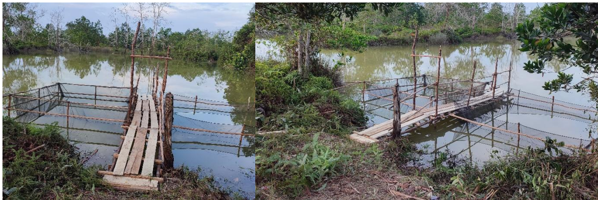
Gambar 3. Tampilan karamba tancap sebagai demplot pengembangan akuaponik apung pada kolong di Desa Tepus.

Pada kolong terpilih dengan kualitas air yang mendukung untuk akuakultur, dirangkai karamba yang digunakan untuk akuaponik apung yang membudidayakan sayuran dan ikan. Dalam kondisi kolong ini, karamba menggunakan sistem tancap karena kedalaman kolong yang tidak terlalu dalam (Gambar 3). Karamba ini dilengkapi dengan waring yang membatasi pergerakan ikan yang dibudidayakan. Karamba ini menjadi batas cakupan demplot dan untuk mencegah lepasnya ikan ke perairan kolong yang luas. Sebagaimana disampaikan oleh Pepayocha et al. (2022), kolong yang umumnya luas dan dalam, dimanfaatkan untuk membududayakan ikan menggunakan karamba jaring.