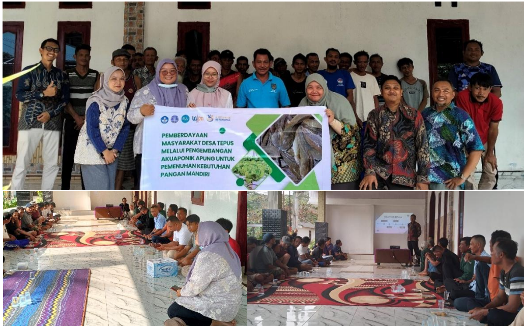
Gambar 4. Pelaksanaan Sosialisasi dan FGD tentang pemanfaatan kolong di Desa Tepus untuk budidaya sistem Akuaponik Apung.

Kepada masyarakat disampaikan bahwa kolong dapat dimanfaatkan untuk budidaya ikan dengan cara yang tepat, salah satunya melalui akuaponik apung ini. Banyaknya kolong yang dimiliki desa, menunjukkan potensi besar untuk produksi ikan. Dipaparkan juga jenis-jenis ikan yang potensial dikembangkan baik dari segi teknis maupun ekonomis, seperti ikan nila, lele dan patin. Ketahanan ikan beradaptasi menjadi pertimbangan memilih ikan-ikan tersebut. Hal ini dikarenakan kolong bekas penambangan timah, meskipun dapat digunakan untuk budidaya ikan, namun cenderung memiliki air yang asam. Saputra (2025) menyampaikan bahwa kolong di Desa Tepus umumnya memiliki pH berkisaran 4.35-5.16.