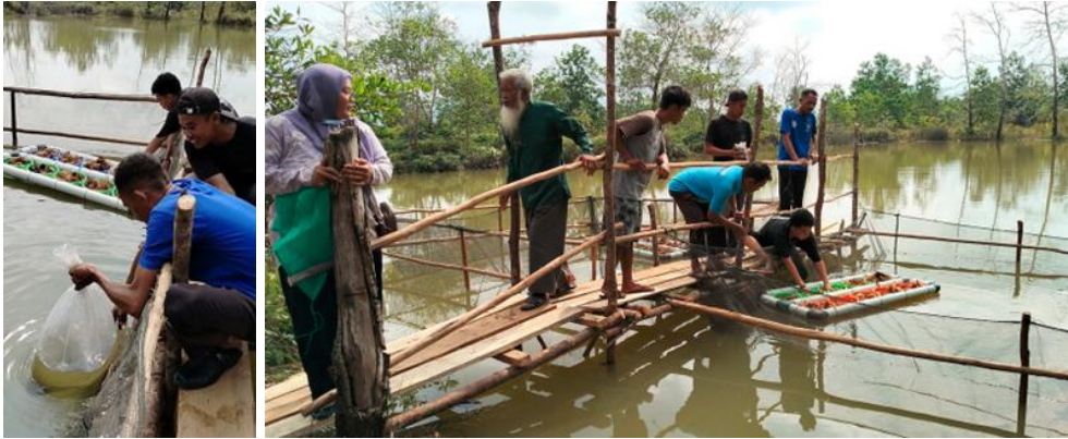
Gambar 5. Penebaran benih ikan dan sayuran pada demplot akuaponik apung pada kolong bekas timah di Desa Tepus.

Kegiatan pengabdian berlanjut pada penebaran benih ikan dan penyemaian sayuran yang dibudidayakan secara terapung pada karamba di kolong. Pada masing-masing karamba yang berukuran 3 x 3 meter, ditebar benih ikan lele berukuran 3 – 4 cm yang dilakukan oleh sekretaris desa Tepus (Gambar 5). Benih kangkung disemai pada akuaponik apung yang menggunakan substrat serabut kelapa sebagai medianya. Ikan lele merupakan jenis ikan yang populer dibudidayakan pada kolong bekas tambang timah (Bidayani, 2007; Silalahi & Tuparjono, 2019; Triswiyana et al. , 2019). Serabut kelapa merupakan salah satu media terbaik untuk budidaya sistem akuaponik (Marlendi & Rahman, 2023).