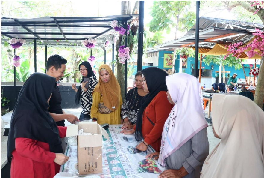
Gambar 6. Narasumber Menyampaikan Materi Pelatihan Penyusunan SOP

mencatat laporan keuangan dengan dua metode, serta memiliki dokumen SOP produksi yang siap diterapkan dalam kegiatan usaha. Penyampaian materi oleh narasumber dapat dilihat pada Gambar 6, serta foto bersama peserta dengan pemateri pada gambar 7.