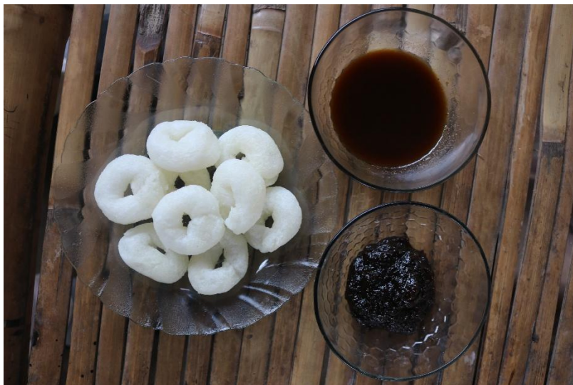
Gambar 3. Produk Yang Diinovasi dan Dikemas Menggunakan Vacum Sealer

Hasil dari pelatihan ini menunjukkan bahwa peserta telah mampu mengoperasikan mesin vacuum sealer, mengemas produk sesuai standar, dan menghasilkan inovasi rasa baru yaitu dua varian. Hasil inovasi pruk dapat dilihat pada Gambar 3