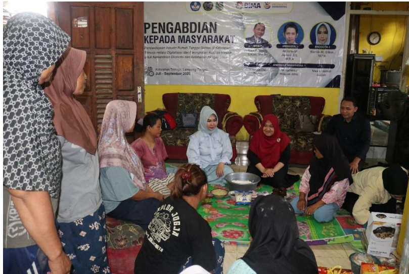
Gambar 2. Kegiatan Pelatihan Inovasi Produk dan Pengemasan

Hasil dari pelatihan ini menunjukkan bahwa peserta telah mampu mengoperasikan mesin vacuum sealer, mengemas produk sesuai standar, dan menghasilkan inovasi rasa baru yaitu dua varian. Hasil inovasi pruk dapat dilihat pada Gambar 3