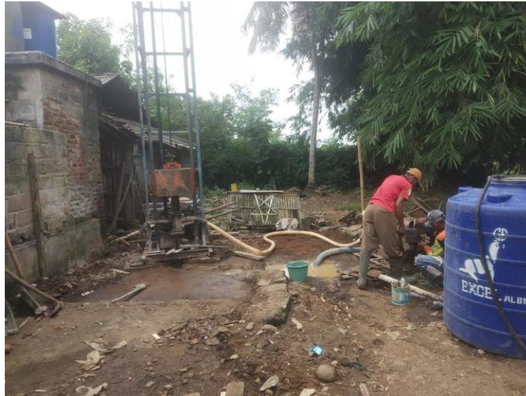
Gambar 9. Pembuatan Sumur Bor di Lokasi Mitra

melalui Tokopedia dan media sosial untuk menjangkau konsumen yang lebih luas. Pada pendampingan, Tim Pengabdian Masyarakat juga memantau pengerjaan sumur bor untuk memastikan kegiatan produksi dapat berjalan tanpa tergantung musim. Gambar kegiatan pengeboran dapat dilihat pada Gambar 7.