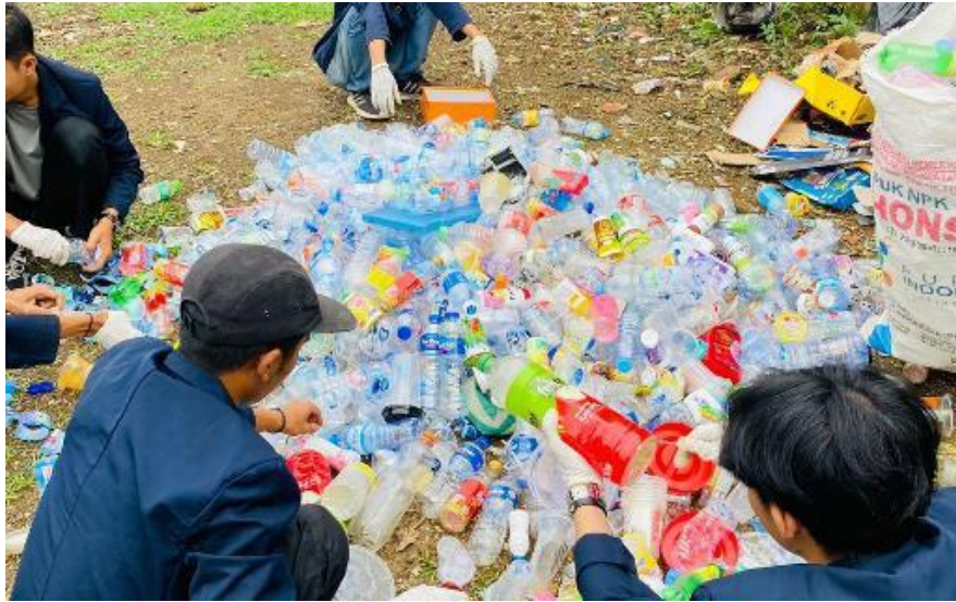
Gambar 4. Pemilahan sampah anorganik

Selain daripada solusi pembuatan biopori untuk sampah organik dan resapan air banjir tim KKNMT mempunyai ide alternatif lain untuk sampah berjenis anorganik yang dimana sampah dengan jenis ini tidak bisa terurai dengan sendirinya maka dari itu perlu pemikiran strategi yang dilakukan oleh tim KKNMT yaitu dengan cara dipilah dan dibersihkan agar sampah anorganik bisa berkurang di tempat pembuangan sampah. Kegiatan ini dilakukan melalui acara “Bazar Sampah” yang memiliki teknis setiap masyarakat yang memberikan sampah anorganik akan mendapatkan timbal balik atau penukaran dalam bentuk sembako dan sabun. Hal ini diharapkan dapat membangkitkan semangat masyarakat dalam tahap awal pemilahan sampah.