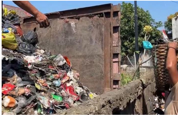
Gambar 2. Kondisi Sampah Yang Menumpuk Di TPS Sukamenak

Pemerintah desa sebenarnya telah melakukan langkah awal dengan menyediakan TPS untuk masyarakat, namun hasil observasi menunjukkan bahwa fasilitas tersebut telah melebihi kapasitas sehingga sampah tidak dapat tertampung di TPS tersebut. Sebagian warga juga menyimpan tempat sampah di dalam rumah karena khawatir jika disimpan diluar rumah akan berantakan sehingga menyebabkan pencemaran lingkungan dan bisa berdampak buruk terhadap kesehatan warga tersbut. Sementara sebagian lainnya menggunakan TPS tersebut untuk keperluan selain pengelolaan sampah. Hal ini menunjukkan adanya kesenjangan antara penyediaan sarana dan pemanfaatannya oleh masyarakat.