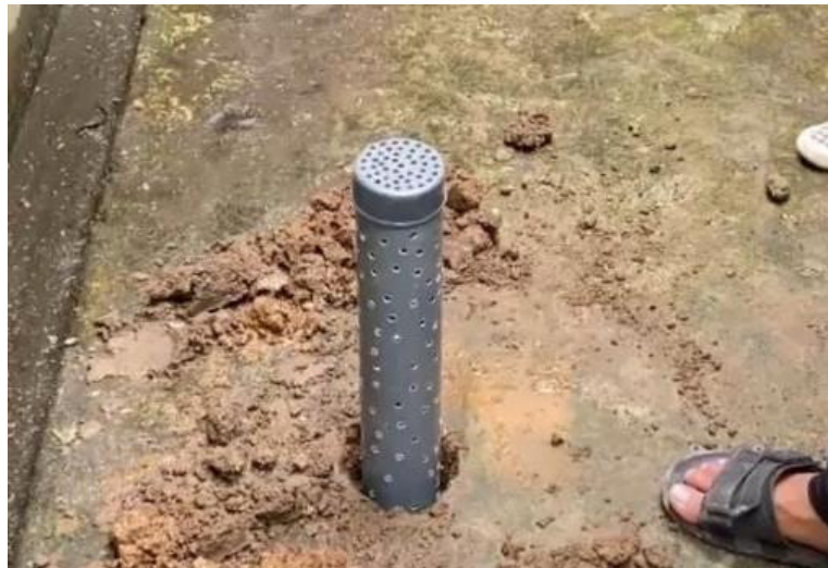
Gambar 3. Pembuatan Lubang Resapan Biopori

Berdasarkan permasalahan yang kami amati dan sesuai dengan hasil identifikasi ditemukan permasalahan yang dihadapi oleh Masyarakat di Desa Sukamenak khususnya di RW 02 yaitu dalam aspek pengelolaan sampah rumah tangga dan genangan air di jalan terlihat bahwa penyebab utama tidak efektifnya pengelolaan sampah organik terletak pada minimnya kesadaran masyarakat dan tidak adanya sistem pendukung yang terintegrasi, dan penyebab utama adanya genangan air di jalan karena perubahan tata guna lahan yang menurunkan daya resapan tanah memperburuk risiko banjir.