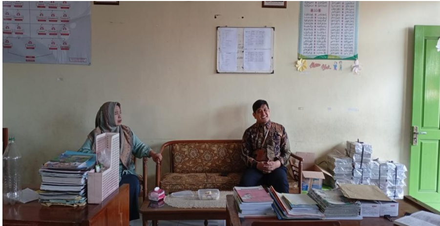
Gambar 2. Sosialisasi Pengabdian

Tahap kedua adalah pelatihan yang dilaksanakan pada 17 Juli 2025. Pelatihan ini terbagi menjadi dua sesi. Sesi pertama ditujukan untuk siswa, dengan materi utama analisis diri menggunakan metode refleksi sederhana. Siswa diajak mengenali diri melalui SWOT pribadi, melakukan roleplay tentang peran pelaku, korban, dan penolong dalam kasus bullying, serta menuliskan afirmasi positif melalui positive self-talk wall.