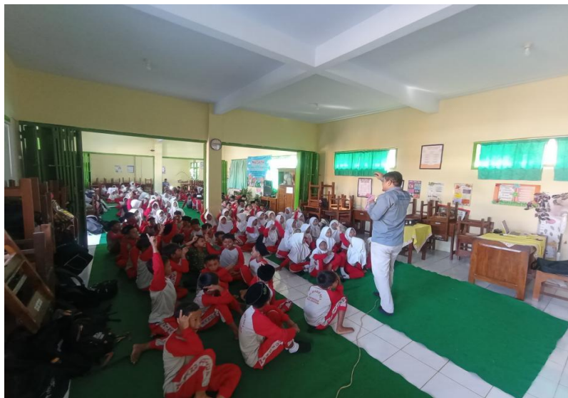
Gambar 3. Sesi Pelatihan Bagi Siswa

Tahap kedua adalah pelatihan yang dilaksanakan pada 17 Juli 2025. Pelatihan ini terbagi menjadi dua sesi. Sesi pertama ditujukan untuk siswa, dengan materi utama analisis diri menggunakan metode refleksi sederhana. Siswa diajak mengenali diri melalui SWOT pribadi, melakukan roleplay tentang peran pelaku, korban, dan penolong dalam kasus bullying, serta menuliskan afirmasi positif melalui positive self-talk wall.