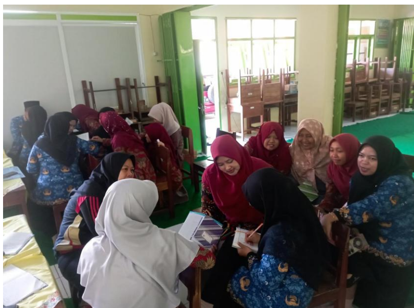
Gambar 5. Pendampingan

Tahap ketiga adalah pendampingan yang dilaksanakan pada 18 Juli 2025. Pada tahap ini, tim pengabdian mendampingi guru dan siswa dalam mempraktikkan hasil pelatihan. Guru difasilitasi untuk mencoba menerapkan komunikasi empati ketika berinteraksi dengan siswa, misalnya dengan cara memberikan respon yang menenangkan dan menghindari bahasa yang menghakimi. Sementara itu, siswa diarahkan untuk menggunakan pojok refleksi kelas sebagai media ekspresi emosi, menuliskan refleksi diri secara singkat, dan menyampaikan komitmen untuk menjauhi bullying. Pendampingan ini memastikan bahwa hasil pelatihan tidak hanya berhenti pada teori, tetapi juga diterapkan langsung dalam kehidupan sekolah sehari-hari.