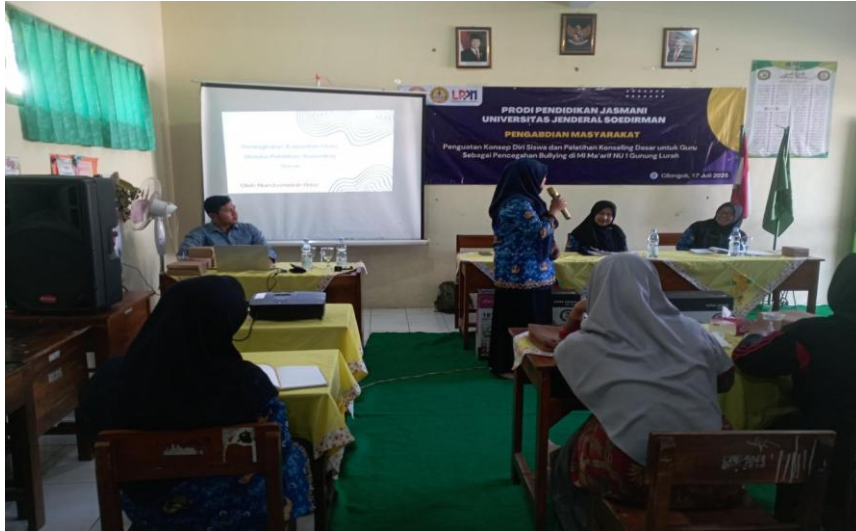
Gambar 4. Sesi Pelatihan Guru

Tahap ketiga adalah pendampingan yang dilaksanakan pada 18 Juli 2025. Pada tahap ini, tim pengabdian mendampingi guru dan siswa dalam mempraktikkan hasil pelatihan. Guru difasilitasi untuk mencoba menerapkan komunikasi empati ketika berinteraksi dengan siswa, misalnya dengan cara memberikan respon yang menenangkan dan menghindari bahasa yang menghakimi. Sementara itu, siswa diarahkan untuk menggunakan pojok refleksi kelas sebagai media ekspresi emosi, menuliskan refleksi diri secara singkat, dan menyampaikan komitmen untuk menjauhi bullying. Pendampingan ini memastikan bahwa hasil pelatihan tidak hanya berhenti pada teori, tetapi juga diterapkan langsung dalam kehidupan sekolah sehari-hari.