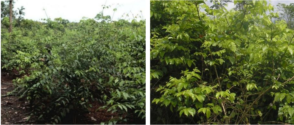
Gambar 1. Ladang Gambir Milik Ketua Kelompok

Daun gambir dapat diolah menjadi produk berwarna coklat muda dengan rasa pahit yang kemudian meninggalkan sensasi manis. Walaupun tidak dikonsumsi sebagai makanan ringan, gambir memiliki berbagai manfaat, baik sebagai obat tradisional, bahan baku kosmetik, pewarna makanan, maupun dalam tradisi menyirih (Harnis et al., 2021). Dari sisi kesehatan, kandungan katekin, tanin, dan asam katekutanat menjadikan gambir berkhasiat sebagai antioksidan serta digunakan untuk mengatasi diare, maag, luka, bisul, sakit kepala, demam, rematik, disentri, hingga sebagai obat kumur (Harnis et al., 2021). Cara penggunaannya umumnya dengan menyeduhnya menggunakan air hangat (Marlinda, 2018).