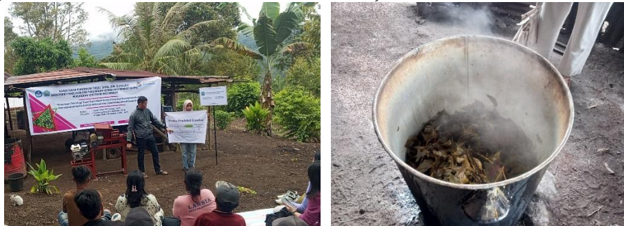
Gambar 11. Penjelasan prosedur perebusan daun gambir

Tim pengabdian menjelaskan prosedur perebusan yang sesuai standar, yaitu perbandingan air dan daun 1:10 dengan waktu perebusan 45 menit (Indonesia & Nasional, 2000). Selanjutnya, mitra bersama tim mempraktikkan perebusan daun gambir, dilanjutkan dengan proses pengendapan getah selama 24 jam dan pengeringan di bawah sinar matahari selama 24 jam.