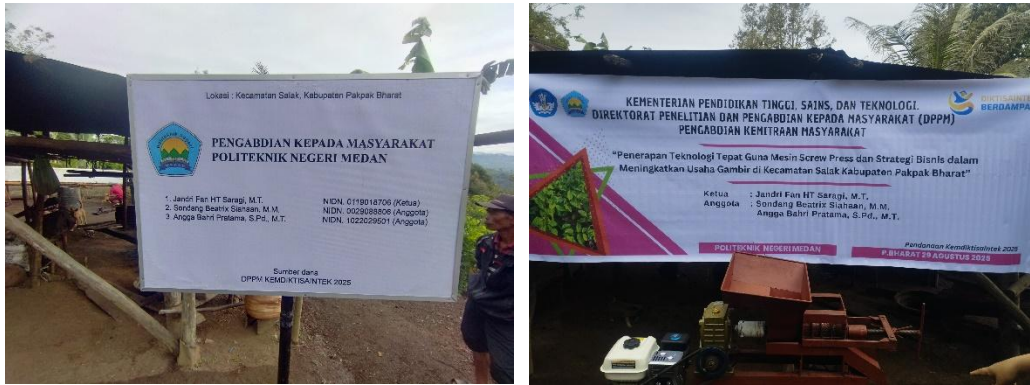
Gambar 8. Proses Pemasangan Plang dan Spanduk

Dalam sambutannya disampaikan bahwa tujuan kegiatan ini adalah membantu mitra meningkatkan produktivitas usaha gambir, mengingat sebelumnya proses pengepresan getah masih menggunakan peralatan sederhana dengan hasil yang terbatas.