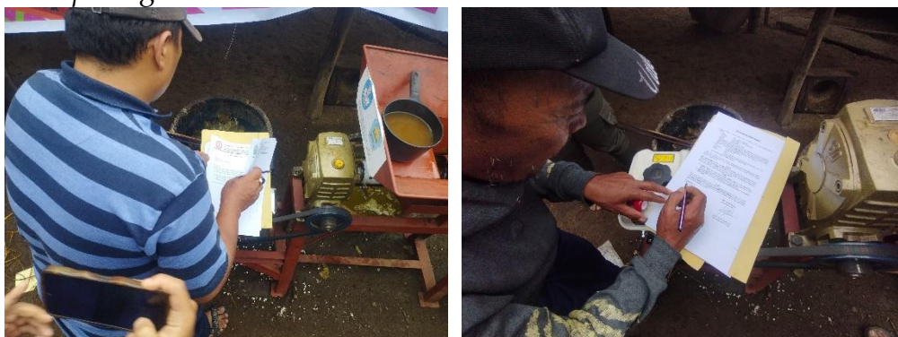
Gambar 9. Penandatanganan dokumen serah terima

Acara dilanjutkan dengan penandatanganan dokumen serah terima dan penyerahan mesin screw press gambir.