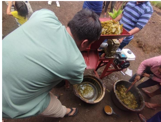
Gambar 14. Proses pengumpulan getah gambir

Pengumpulan Getah Gambir, Getah gambir yang telah diperas akan turun melalui saringan dan dialirkan menuju saluran penampungan. Getah yang terkumpul ini kemudian dapat dikeringkan untuk mendapatkan produk gambir dalam bentuk padatan siap jual.