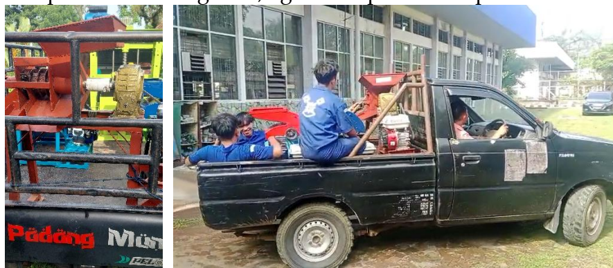
Gambar 7. Proses Pengiriman Mesin Screw Press

Setelah perakitan selesai, dilakukan pengecatan serta uji coba pada 15 Agustus 2025. Hasil uji coba menunjukkan mesin berfungsi dengan baik dan seluruh komponennya bekerja optimal. Dengan demikian, mesin dinyatakan siap untuk dikirim ke lokasi mitra di Pakpak Bharat. Pengiriman dilakukan pada 25 Agustus 2025 lebih awal dari pelaksanaan kegiatan, agar mempermudah proses teknis di lapangan.