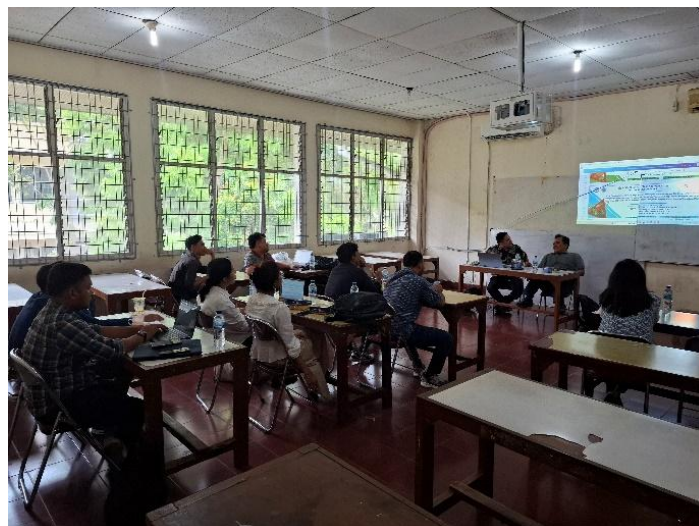
Gambar 5. Rapat Tim

Yang meliputi penyusunan jadwal kegiatan, koordinasi dengan mitra, perancangan sekaligus pembuatan mesin, serta persiapan peralatan dan bahan yang diperlukan. Tim pengabdian melaksanakan tahap perencanaan melalui rapat/ Forum Group Discussion (FGD) pada 10 Juli 2025. Dari hasil rapat tersebut disusun agenda kegiatan pengabdian, antara lain: Perakitan mesin screw press gambir pada 15 Juli hingga 15 Agustus 2025. Pelaksanaan kegiatan pengabdian di lokasi mitra pada 29–30 Agustus 2025.