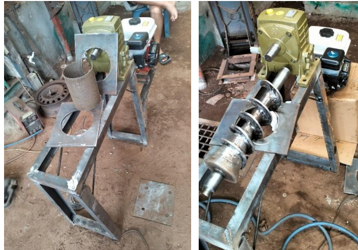
Gambar 6. Proses Perakitan Mesin Screw Press

perlengkapan pendukung lainnya. Proses perakitan mesin dilakukan oleh tim pengabdian mulai 15 Juli 2025.