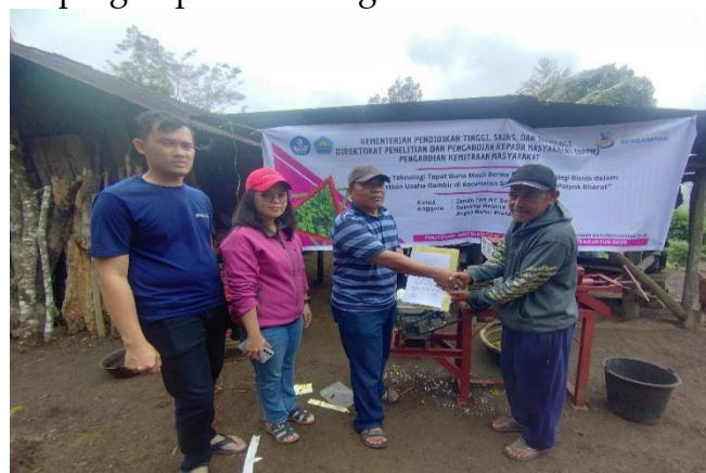
Gambar 10. Serah Terima Mesin Screw Press

Mesin tersebut memiliki kapasitas hasil pengepresan 100 kg getah dalam waktu 1 jam (Putra et al., 2025). Setelah mesin diserahkan, kegiatan berikutnya adalah pelatihan dan pendampingan pembuatan gambir berkualitas dan terstandar.