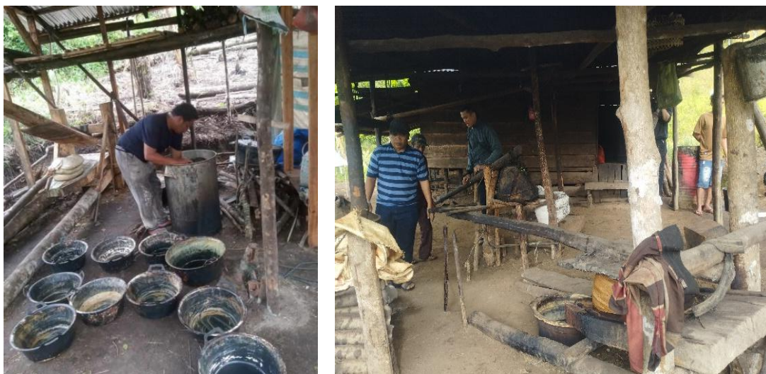
Gambar 3. Proses pengolahan gambir tradisional

Berdasarkan gambar 2 di atas, terlihat bahwa proses pengolahan gambir masih dilakukan secara sederhana tanpa bantuan mesin modern. Kondisi ini menyebabkan rendahnya hasil ekstraksi getah gambir yang berdampak pada minimnya jumlah produksi. Tahapan produksi dimulai dari pemetikan daun, kemudian dicuci, dimasukkan ke dalam goni, dan direbus. Setelah direbus, daun gambir kembali dimasukkan ke goni untuk dipress sehingga keluar ekstraknya berupa getah gambir (Barat & Goenawan, 2020). Permasalahan utama terletak pada tahap pengepresan yang masih mengandalkan peralatan seadanya tanpa mesin.