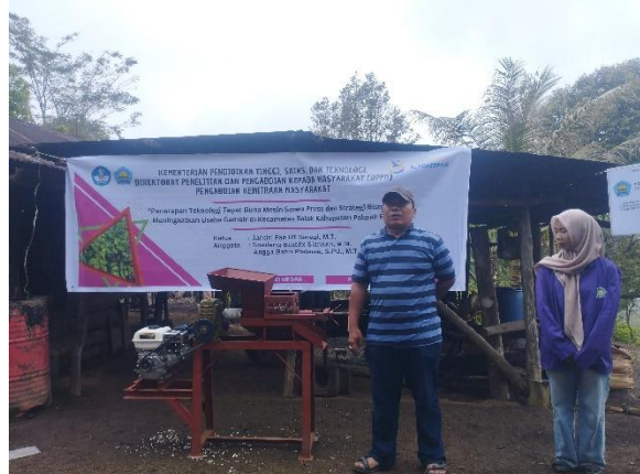
Gambar 12. Penjelasan sistem operasi mesin screw press

Pada tahap penggunaan mesin screw press , dilakukan pada kunjungan kedua, yaitu melakukan Langkah-langkah yang meliputi: menghidupkan motor untuk menggerakkan gear box yang berfungsi sebagai transmisi daya. Gear box meningkatkan torsi dan menyesuaikan putaran dari motor agar sesuai dengan kebutuhan screw press . Screw press kemudian mulai berputar untuk memulai proses pengepresan.