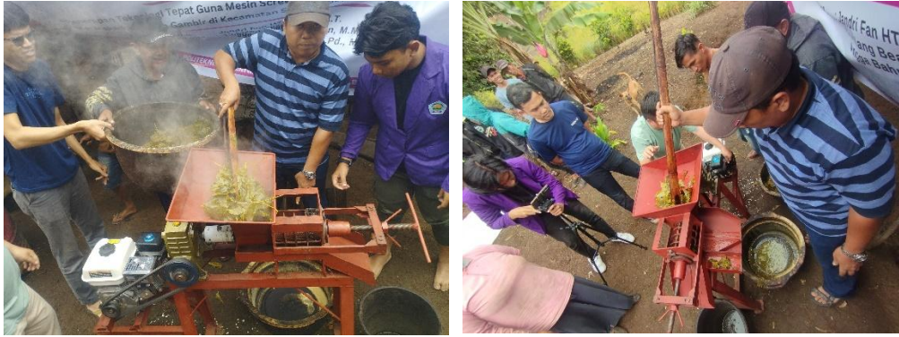
Gambar 13. Proses Pengepresan daun gambir

Pengumpulan Getah Gambir, Getah gambir yang telah diperas akan turun melalui saringan dan dialirkan menuju saluran penampungan. Getah yang terkumpul ini kemudian dapat dikeringkan untuk mendapatkan produk gambir dalam bentuk padatan siap jual.