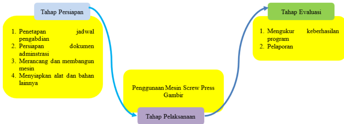
Gambar 4. Metode Pelaksanaan Kegiatan