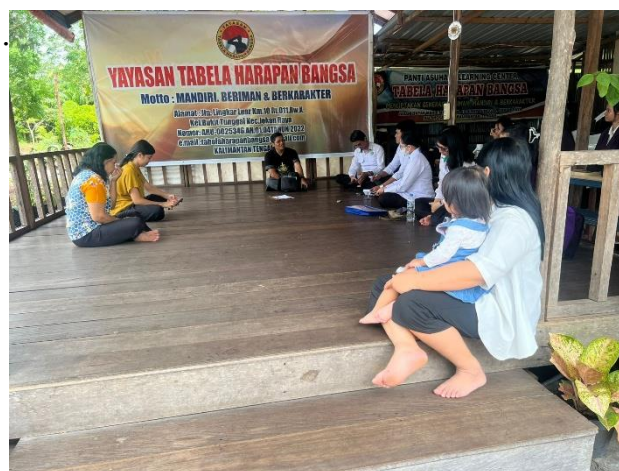
Gambar 3. Observasi dan Wawancara

Pada tahap ini, tim PKM juga melakukan observasi dan wawancara di Yayasan Panti Asuhan Tabela Harapan Bangsa, seperti yang terlihat pada Gambar 3 Observasi dan Wawancara . Hasil dari tahap ini berupa deskripsi Yayasan yang detail, menyeluruh, dan mendalam. Selain itu, tim juga menyusun rencana tindak lanjut yang akan menjadi panduan bagi pengurus panti dalam melaksanakan pendampingan ke depan