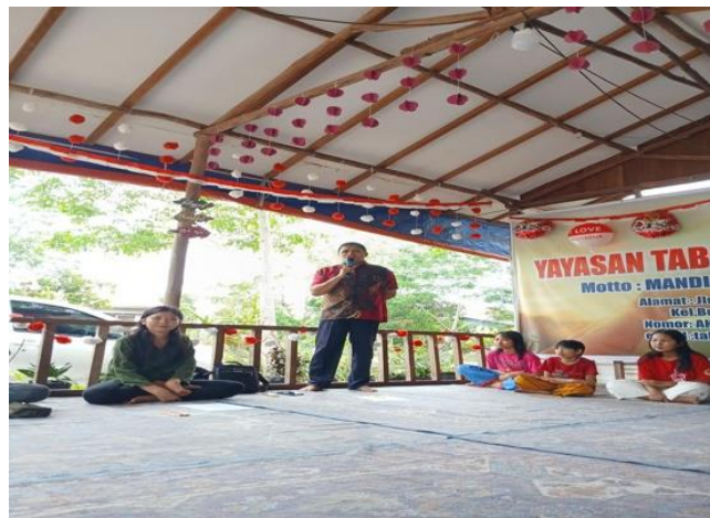
Gambar 5. Rencana Aksi

benar-benar selaras dengan kondisi serta kebutuhan pengurus yayasan dan anak-anak di panti asuhan.