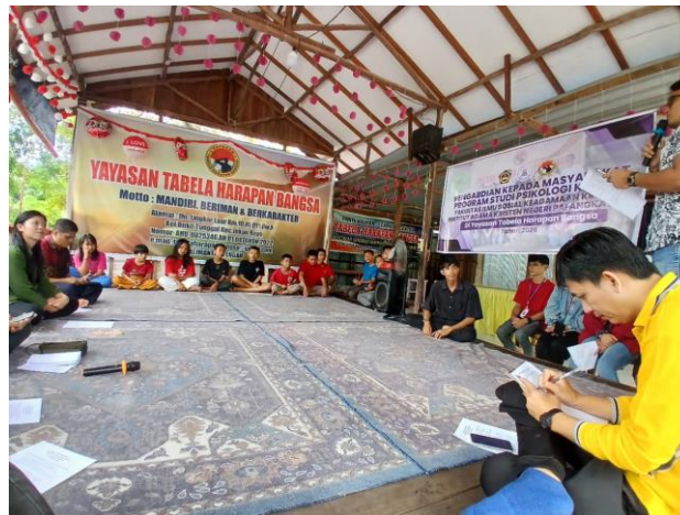
Gambar 4. Pelaksanaan Focus Group Discussion (FGD)

Tahap berikutnya adalah pelaksanaan Focus Group Discussion (FGD) oleh tim untuk menggali lebih dalam permasalahan dan kebutuhan di Yayasan Panti Asuhan Tabela Harapan Bangsa, seperti yang terlihat pada Gambar 4 Pelaksanaan Focus Group Discussion (FGD) . Dengan memahami kondisi dan kebutuhan tersebut secara menyeluruh, tim dapat merancang program yang relevan dan tepat sasaran. Langkah ini sangat penting agar program yang dibuat benar-benar sesuai dengan aspirasi dan potensi anak-anak panti, sehingga menghasilkan dampak positif yang berkelanjutan bagi yayasan maupun lingkungan sekitarnya.