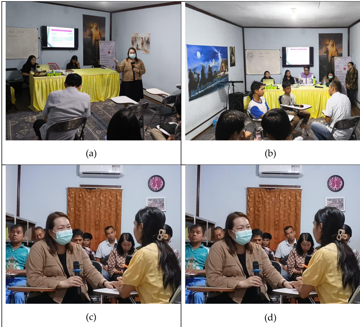
Gambar 6. Pelatihan dengan Metode Role Play

Dengan menghadirkan narasumber yang menggunakan metode interaktif dan berfokus pada praktik langsung, pelatihan ini dirancang agar setiap peserta dapat benar-benar memahami dan menguasai keterampilan yang diajarkan. Suasana pelatihan berlangsung dengan antusiasme tinggi, di mana para peserta aktif bertanya dan berlatih, menunjukkan minat besar untuk meningkatkan kemampuan mereka. Melalui pelatihan ini, para pengurus di Yayasan Panti Asuhan Tabela Harapan Bangsa dapat memperkuat kapasitas diri mereka untuk manfaat jangka panjang.