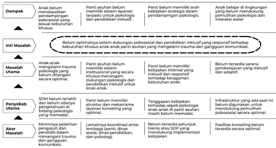
Diagram 1. Pohon Masalah

Diagram Pohon Masalah yang digunakan dalam analisis situasi mengindikasikan bahwa permasalahan utama terletak pada belum maksimalnya sistem dukungan psikososial dan pendidikan inklusif yang mampu merespons kebutuhan khusus anak-anak di panti asuhan. Akar dari permasalahan ini dapat ditelusuri pada empat faktor utama: ketiadaan pelatihan khusus bagi pendamping, belum terbentuknya forum koordinasi antar lembaga terkait, belum adanya regulasi atau SOP yang mengatur pendidikan inklusif, serta belum tersusunnya sistem pendampingan psikososial yang sesuai dengan kebutuhan anak. Akibat dari kondisi ini, anak-anak belajar dalam lingkungan yang belum mendukung proses pemulihan psikologis maupun pengembangan potensi diri mereka secara optimal.