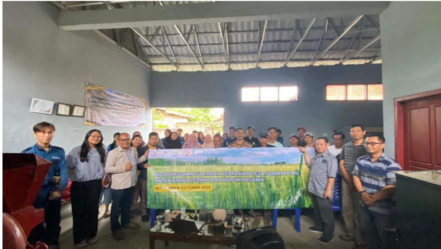
Gambar 2. Workshop Pemanfaatan Limbah Jerami Padi oleh Tim PkM

persiapan bahan, pengoperasian alat, hingga penerapan hasil kegiatan di lapangan. Melalui kegiatan ini diharapkan terjadi kesepahaman antara tim pelaksana dan mitra, sehingga pelaksanaan program dapat berjalan efektif dan sesuai dengan kebutuhan kelompok tani.