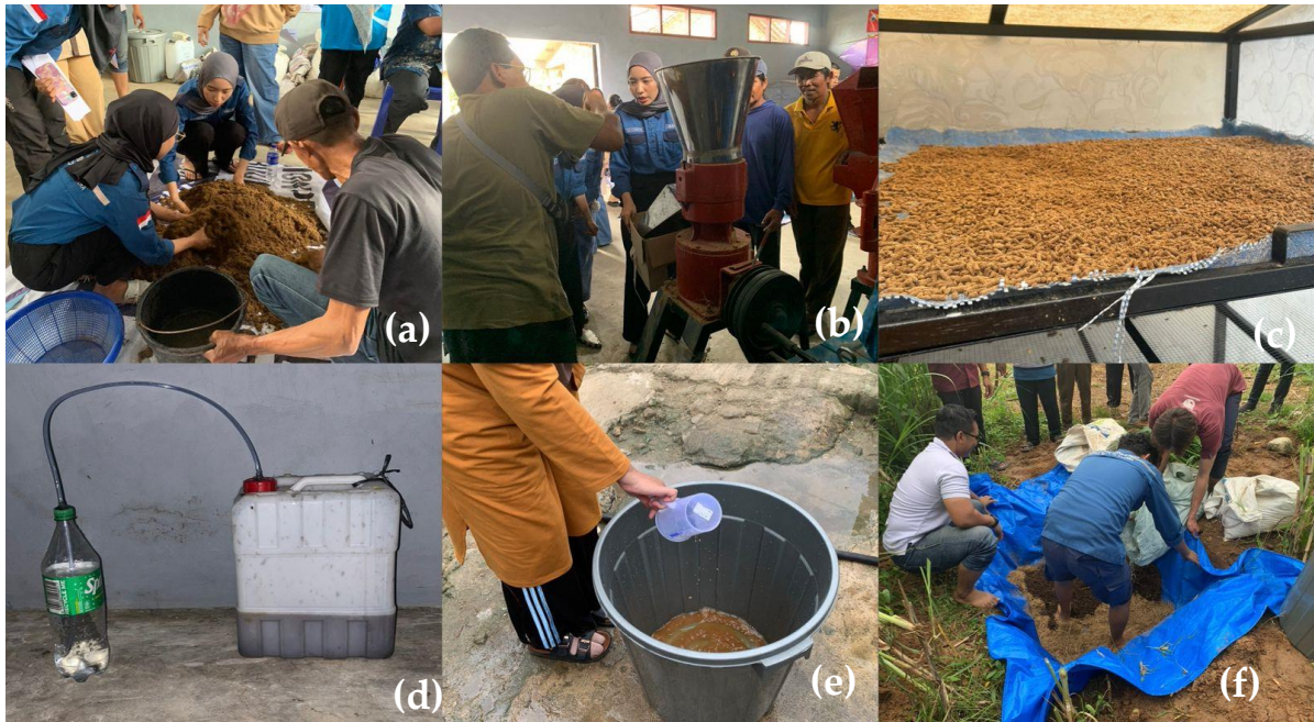
Gambar 4. (a) Proses pencampuran bahan pellet, (b) Proses pencetakan pellet, (c) Proses pengeringan pellet, (d) Wadah fermentasi MOL sederhana, (e) Pelarutan MOL dengan air, (f) Proses penghamparan berlapis bahan pupuk.

Dokumentasi rangkaian kegiatan tertera pada Gambar 4. Penghujung kegiatan dilakukan pengisian kuisisioner post-test oleh peserta dan dipandu oleh tim PkM. Berdasarkan hasil evaluasi yang disajikan pada Gambar 5, terjadi peningkatan yang signifikan pada aspek pengetahuan peserta setelah kegiatan pendampingan dilaksanakan. Sebelum kegiatan ( pre-test ), sebagian besar peserta berada pada kategori tidak mengerti dengan persentase mencapai sekitar 85%, sementara sisanya berada pada kategori sedikit mengerti sekitar 15%. Setelah kegiatan ( post-test ), persentase peserta yang mengerti meningkat hingga sekitar 86%, sangat mengerti mencapai sekitar 13%, dan sedikit mengerti sekitar 1%, sedangkan kategori tidak mengerti tidak lagi ditemukan. Hal ini menunjukkan bahwa kegiatan workshop dan pendampingan yang dilakukan mampu meningkatkan pemahaman peserta terhadap pemanfaatan limbah pertanian, khususnya jerami, sebagai bahan campuran pupuk organik dan pakan ternak.