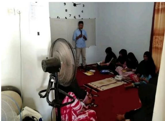
Gambar 5. Pemberian Materi tentang Pengemasan

Proses selanjutnya adalah pengemasan. Pada tahap ini, peserta didorong untuk langsung mempraktikkan teknik pengemasan yang telah mereka pelajari. Tim penyuluh dan mahasiswa magang memberikan bimbingan langsung kepada peserta dalam memilih bahan kemasan yang tepat, serta cara mengemas produk dengan efisien agar tetap terjaga kualitasnya dan tidak mudah rusak. Teknik pengemasan yang diajarkan berfokus pada penggunaan plastik kemasan yang dirancang khusus untuk menjaga kesegaran produk pertanian, serta memberi kesan estetika yang menarik bagi konsumen. Selama kegiatan, peserta sangat antusias dan aktif berpartisipasi dalam setiap langkah, menunjukkan keterlibatan yang tinggi dalam proses belajar dan pengembangan keterampilan baru.