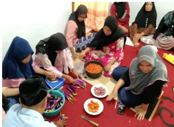
Gambar 6. Memisahkan Bahan-Bahan Sesuai Komoditas

Pada Gambar 5 di atas, tampak sesi pemberian materi mengenai pengemasan produk pertanian yang sedang dilaksanakan oleh tim penyuluh pertanian. Tim memberikan penjelasan langsung kepada ibu-ibu Kelompok Wanita Tani (KWT)