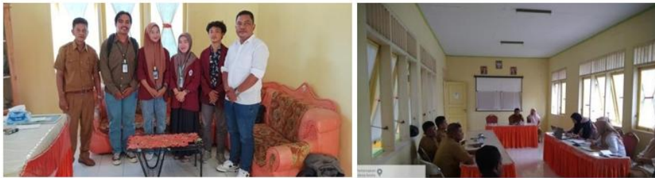
Gambar 2. Kunjungan Lapangan Sekaligus Diskusi dengan Pemerintah Setempat

yang akan dilatih dalam pengemasan. Pengamatan ini sangat penting karena memberikan gambaran tentang jenis produk yang banyak dihasilkan oleh masyarakat desa, serta kebutuhan spesifik yang dimiliki oleh Kelompok Wanita Tani (KWT). Dengan memahami kondisi dan potensi produk, pelatihan dapat disesuaikan dengan jenis produk yang ada, sehingga peserta dapat lebih mudah mengimplementasikan teknik yang diajarkan.