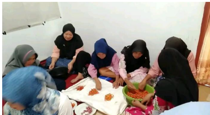
Gambar 4. Persiapan alat dan Bahan

Pada Gambar 3 di atas dapat dilihat bagaimana tim melakukan koordinasi dengan Kelompok Wanita Tani (KWT). Koordinasi ini bertujuan untuk memastikan adanya partisipasi aktif dari seluruh anggota KWT dan kesiapan mereka dalam mengikuti pelatihan. Hal ini juga untuk memastikan bahwa kegiatan pelatihan berjalan dengan lancar dan sesuai dengan harapan masyarakat. Partisipasi aktif sangat penting dalam pendekatan partisipatif, di mana setiap peserta diberikan kesempatan untuk berbagi pengalaman dan menyesuaikan teknik dengan kondisi mereka masing-masing. Koordinasi ini memberikan kepastian bahwa kegiatan yang direncanakan bisa berjalan dengan optimal, serta melibatkan semua pihak yang relevan.