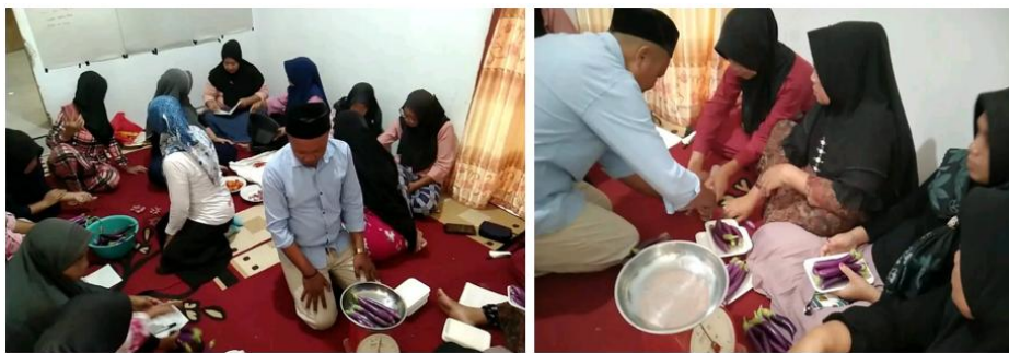
Gambar 7. Proses Menimbang dan Mengemas Produk Pertanian

yang sesuai dengan karakteristik produk pertanian, serta cara-cara pengemasan yang dapat memastikan produk tetap terjaga kualitasnya selama masa distribusi. Selain itu, peserta juga diajarkan mengenai pentingnya desain kemasan yang menarik, agar produk tidak hanya terjaga kesegarannya tetapi juga lebih diminati oleh konsumen. Tim penyuluh dan mahasiswa magang terus mendampingi peserta dengan memberikan umpan balik secara langsung, serta memfasilitasi diskusi kelompok untuk saling berbagi pengalaman dan solusi terkait tantangan yang dihadapi selama proses pengemasan. Kegiatan ini tidak hanya meningkatkan keterampilan teknis peserta, tetapi juga membangun rasa percaya diri mereka dalam menghadapi pasar yang semakin kompetitif.