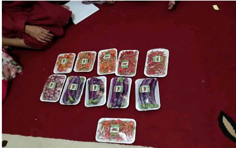
Gambar 8. Hasil produk pertanian sudah dalam bentuk kemasan

Gambar di atas menunjukkan hasil akhir dari proses pengemasan produk pertanian yang telah dilakukan oleh anggota Kelompok Wanita Tani (KWT). Setelah melalui tahap pelatihan dan bimbingan, para peserta kini telah berhasil mengemas produk mereka dalam kemasan yang rapi dan menarik. Dalam gambar ini, terlihat berbagai jenis produk pertanian yang telah dipisahkan dan dikemas secara cermat, seperti cabai, tomat, bawang merah, dan terong, masing-masing dalam wadah kemasan yang sesuai. Setiap kemasan dilabeli dengan stiker yang mencantumkan informasi produk, yang tidak hanya berfungsi untuk memberikan identifikasi, tetapi juga menambah nilai estetika dan profesionalisme produk tersebut.