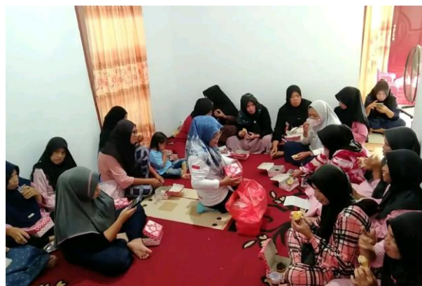
Gambar 3. Diskusi dan Koordinasi bersama Kelompok Wanita Tani

Gambar 2 di atas menunjukkan suasana kunjungan lapangan yang dilakukan oleh tim pengabdian kepada masyarakat, yang sekaligus melakukan diskusi dengan pemerintah setempat khususnya Balai Penyuluh Pertanian (BPP) Kecamatan Bulango Utara Kabupaten Bone Bolango. Dalam foto sebelah kiri, tampak tim pengabdian yang terdiri dari mahasiswa magang dan penyuluh pertanian, berpose bersama pihak pemerintah setempat sebelum memulai diskusi. Di sebelah kanan, terlihat suasana pertemuan yang berlangsung di ruang rapat BPP, di mana para peserta diskusi, termasuk Kepala BPP dan pegawai kantor BPP, sedang membahas rincian pelaksanaan kegiatan. Kunjungan ini sangat penting untuk memastikan adanya koordinasi yang baik antara pemerintah dan masyarakat, serta memastikan bahwa kegiatan pengabdian dapat berjalan dengan lancar dan sesuai dengan kebutuhan serta harapan masyarakat setempat.