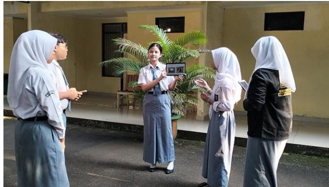
Gambar 4. Praktik Pemanduan Wisata ( mini guiding project )

Siswa akan melakukan praktik pemanduan secara berkelompok di lingkungan sekolah atau di lokasi simulasi yang telah disiapkan, bertindak sebagai pemandu wisata dengan narasi yang telah disiapkan dalam bahasa Indonesia dan Inggris. Mini guiding project dilakukan oleh siswa dalam kelompok dalam menyampaikan materi guiding on site -nya (Gambar 4). Praktik dimulai dengan opening , penjelasan materi guiding , dan closing .