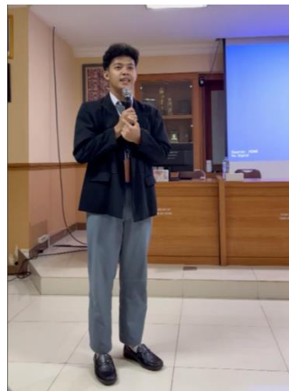
Gambar 3. Siswa melakukan Roleplay Pemanduan Wisata di SMKN 57 Jakarta

Setelah penyampaian materi, untuk meningkatkan keterampilan praktis siswa, digunakan metode roleplay , dengan penggunaan bahasa Inggris dalam situasi nyata seperti menyambut tamu, menjelaskan objek wisata, atau menjawab pertanyaan wisatawan. Roleplay dilakukan dalam 2 kelompok besar, yang praktiknya dilakukan di dalam kelas, dengan pembagian peran yaitu sebagai tour leader/local guide di destinasi wisata, dan sisanya menjadi tamu mancanegara yang berperan sebagai wisatawan di Kota Jakarta. Peran Tour leader dilakukan bergantian, namun karena keterbatasan waktu sehingga hanya dilakukan pergantian sebanyak 3 kali.