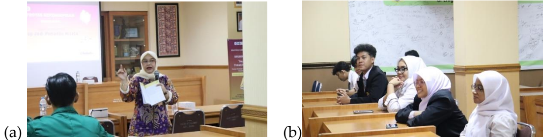
Gambar 2 Foto Ceramah interaktif PKM di SMK Negeri 57 Jakarta

konsentrasi Usaha Layanan Wisata SMK Negeri 57 Jakarta selama proses pelatihan menyimak dengan seksama dan aktif dalam kegiatan diskusi pada sesi tanya jawab.