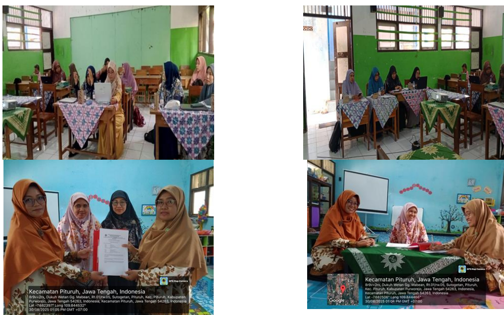
Gambar 2. Foto Kegiatan