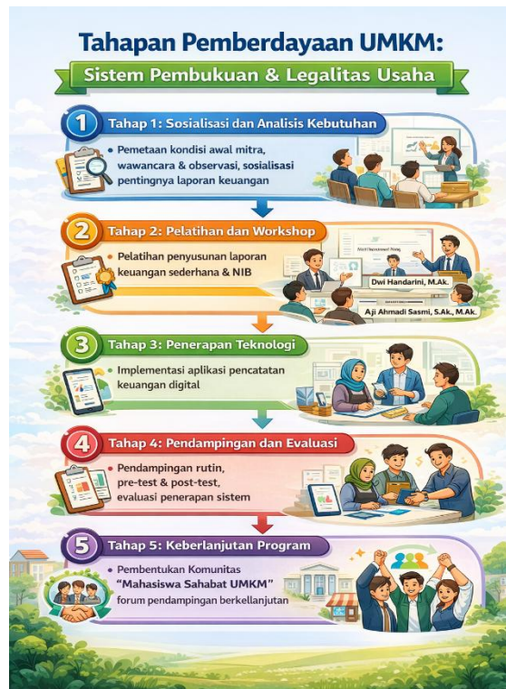
Gambar 1. Alur Kegiatan

Sebagai tindak lanjut, dibentuk komunitas kecil “Mahasiswa Sahabat UMKM” yang berfungsi sebagai forum pendampingan berkelanjutan. Program ini diharapkan menjadi model kolaborasi antara perguruan tinggi dan masyarakat yang berorientasi pada peningkatan literasi keuangan dan pertumbuhan ekonomi lokal.