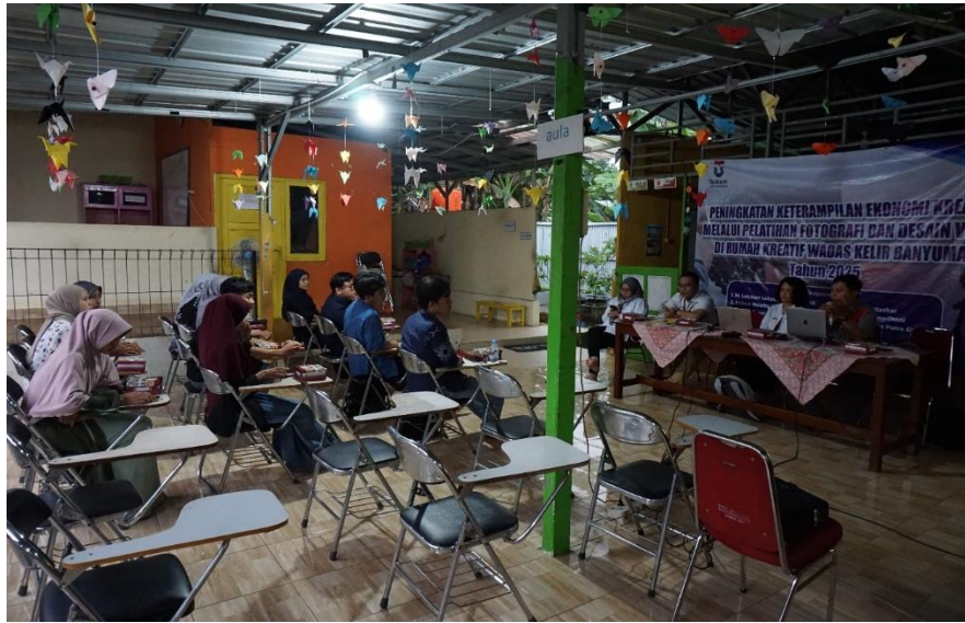
Gambar 3. Diskusi dengan Para Peserta Pelatihan Fotografi dan Editing Video