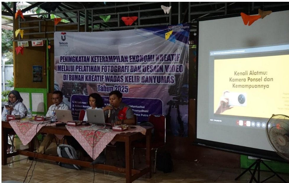
Gambar 2. Pelaksanaan Pelatihan Fotografi dan Editing Video

Dari sisi dampak ekonomi, peningkatan jumlah UMKM yang memiliki konten promosi digital dari 20% menjadi 85% menunjukkan kontribusi nyata program terhadap penguatan pemasaran produk lokal melalui media sosial. Secara keseluruhan, hasil ini menegaskan bahwa program pengabdian masyarakat berbasis pelatihan fotografi, desain grafis, dan editing video efektif dalam meningkatkan kapasitas ekonomi kreatif masyarakat Desa Wadas Kelir serta mendukung branding desa secara berkelanjutan.