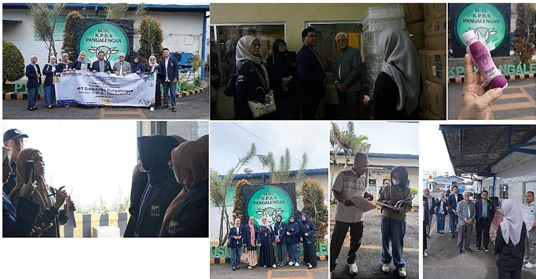
Gambar 2. Foto Kegiatan

Kegiatan ini dapat berjalan dengan baik berkat kerja sama dan dukungan berbagai pihak. Kami mengapresiasi Koperasi Peternakan Bandung Selatan Pangalengan atas keterbukaan, partisipasi aktif, dan komitmen yang tinggi selama kegiatan berlangsung. Terima kasih juga kami sampaikan kepada Rektor dan Tim PKM Pasca Sarjana Universitas Adhirajasa Reswara Sanjaya atas dedikasi, kontribusi keilmuan, serta kerja keras dalam merancang dan melaksanakan kegiatan ini. Semoga hasil PKM ini memberikan manfaat nyata, khususnya dalam penguatan kualitas sumber daya manusia dan peningkatan kinerja koperasi secara berkelanjutan.