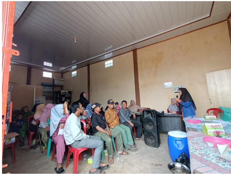
Gambar 2. Sosialisasi pemanfaatan kuli kopi