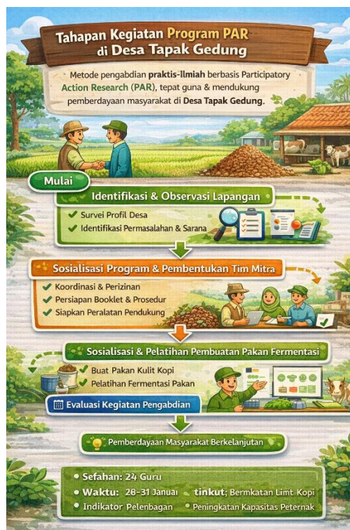
Gambar 1. Alur Kegiatan PKM