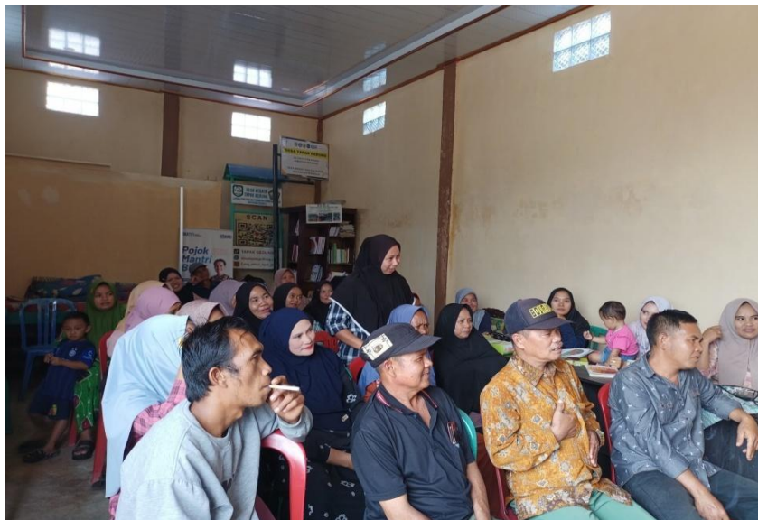
Gambar 6. Diskusi dan Tanya Jawab Selama Proses Pelatihan dan Pendampingan Pembuatan Pakan Ternak dari Kulit Kopi