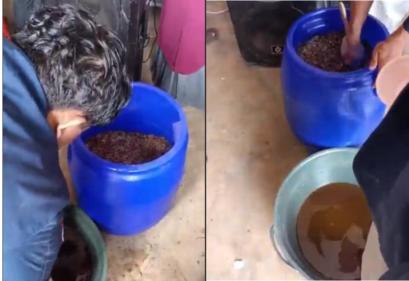
Gambar 5. Proses pencampuran bahan berupa kulit kopi, dedak, molase dan air sesuai perbandingan Pelaksanaan pelatihan ditutup dengan diskusi serta tanya jawab (Gambar 5)

Proses pelatihan diawali langsung dengan pencampuran semua bahan yang diperlukan ke dalam tong tempat terjadinya fermentasi (Gambar 4), ditutup rapat. Selanjutnya bahan siap difermentasi selama 21 hari.