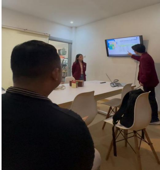
Gambar 5. Sesi Penjelasan Metode Simulasi

simulasi yang dilakukan bersama UMKM Omochi, diketahui pada tahun berjalan belum dikenakan pajak karena total omzet usaha masih berada dibawah Rp 500 juta. Selain itu, dilakukan uji coba dengan asumsi peningkatan omzet untuk mengetahui periode mulai dikenakannya kewajiban pajak.