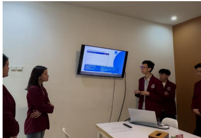
Gambar 3. Sesi Pemaparan Materi

pengaktifan akun Coretax , pengklasifikasian pajak UMKM, serta tahapan pelaporan SPT Tahunan melalui Coretax .