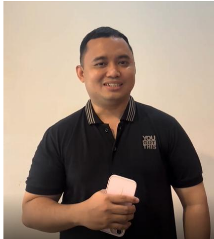
Gambar 6. Sesi Wawancara

meningkatkan pemahaman peserta secara signifikan, baik terkait konsep dasar perpajakan, mekanisme, kesadaran akan pentingnya NPWP, maupun sistem Coretax . Hasil kegiatan pengabdian ini sejalan dengan penelitian Situmorang (2025), yang menekankan pentingnya pelatihan dan sosialisasi perpajakan bagi pelaku UMKM. Sejalan dengan hal tersebut, Fauziah et al. (2023) juga menegaskan bahwa pelatihan perpajakan berperan penting dalam meningkatkan pemahaman pelaku UMKM. pada Gambar 6, sesi wawancara bersama pemilik UMKM Omochi.