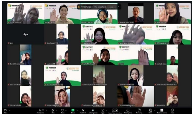
Gambar 2. Pelaksanaan PKM

Melalui penerapan pendekatan pembelajaran partisipatif edukatif, peserta diharapkan tidak hanya memahami materi secara teoritis, tetapi juga mampu mengaplikasikan gagasan tersebut dalam konteks nyata. Keterpaduan antara aspek teori dan praktik dalam proses pembelajaran diyakini dapat memberikan dampak positif terhadap mutu pelatihan serta keberhasilan penerapan konsep yang telah dipelajari.