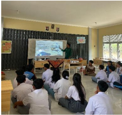
Gambar 2. Sosialisasi BMC