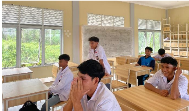
Gambar 3. Siswa memberikan pertanyaan