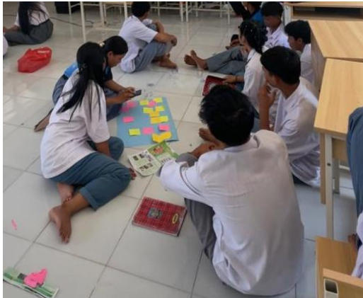
Gambar 6. Merumuskan 9 Komponen