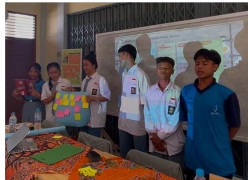
Gambar 9. Presentasi Hasil BMC