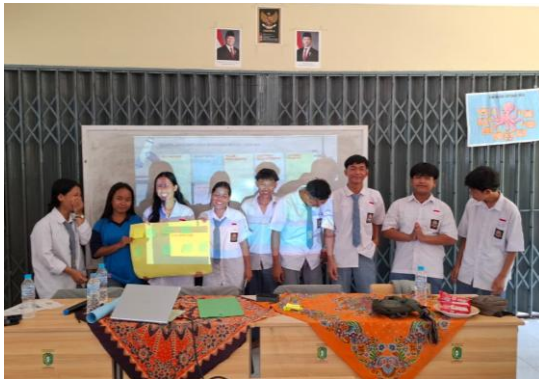
Gambar 8. Presentasi Hasil BMC

Seluruh kelompok melakukan presentasi hasil BMC yang telah mereka rumuskan untuk dijelaskan kepada seluruh siswa agar dapat mengetahui lebih jelas mengenai ide bisnisnya.