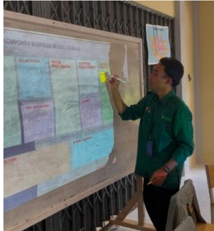
Gambar 10. Evaluasi Hasil BMC