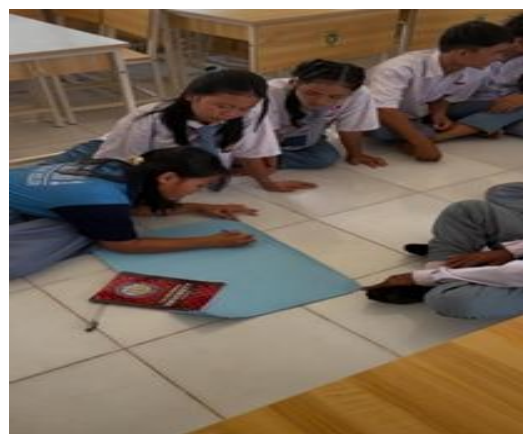
Gambar 5 Merumuskan Ide Bisnis