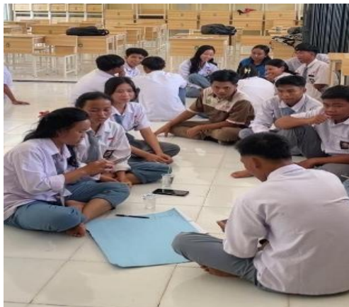
Gambar 4 Menentukan Ide Bisnis

Seluruh siswa dilakukan pembagian menjadi 4 kelompok dengan masing-masing beranggotakan 8–9 siswa. Kemudian setiap kelompok wajib menentukan ide bisnis apa yang akan mereka kembangkan dengan menggali dari setiap potensi yang ada di sekitar mereka untuk dilakukan kegiatan wirausaha.