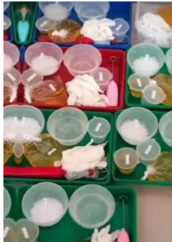
Gambar 5. Alat dan Bahan Pembuatan Sabun