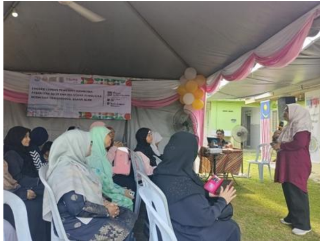
Gambar 4. Penyampaian materi Pelatihan pembuatan Kosmetika bahan Alam

memperkuat green trust konsumen terhadap produk kosmetik yang dinilai aman dan bertanggung jawab secara lingkungan (Handriana et al., 2024).