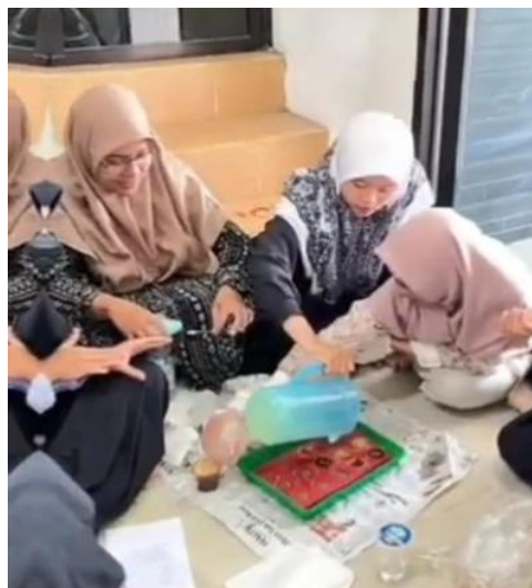
Gambar 6, Praktik Pembuatan Sabun Berkelompok