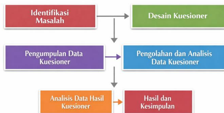
Gambar 1. Metodologi Penelitian

Pada Gambar 1. merepresentasikan tahapan sistematis dalam pelaksanaan kegiatan Pengabdian kepada Masyarakat (P2M) yang berkaitan