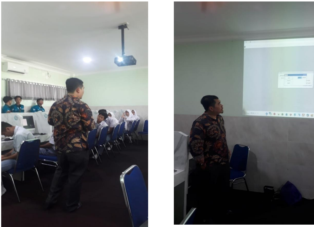
Gambar 4. Pelaksanaan Kegiatan Pelatihan di Perguruan Annida Al Islamy

Perubahan distribusi nilai ini mengindikasikan bahwa kegiatan pelatihan yang dilakukan berhasil meningkatkan kompetensi siswa dalam memahami konsep dasar jaringan, khususnya dalam praktik konfigurasi bridge dan DHCP. Secara keseluruhan, grafik tersebut menunjukkan adanya peningkatan signifikan pada hasil belajar peserta setelah mengikuti pelatihan, yang menandakan bahwa metode pembelajaran berbasis praktik yang diterapkan dalam kegiatan pengabdian tersebut efektif dalam meningkatkan literasi jaringan komputer pada siswa.