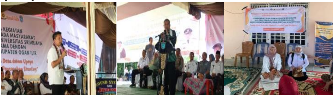
Gambar 5. Kegiatan Pelaksanaan Utama