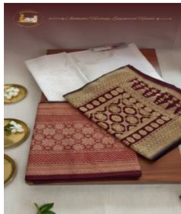
Gambar 2. Hasil Songket Daro Sriwijaya

Beberapa contoh kain songket yang telah dibuat oleh para pengrajin Songket Daro Sriwijaya. Melalui pendekatan heritage branding , gambar ini menunjukkan bagaimana motif songket diangkat kembali sebagai nilai jual utama ( unique selling point ). Makna di balik motif dalam bentuk katalog digital dan fisik ini berfungsi sebagai instrumen edukasi bagi konsumen, sekaligus sebagai upaya pelestarian kekayaan intelektual budaya lokal yang menjadi pembeda utama dari produk kompetitor.