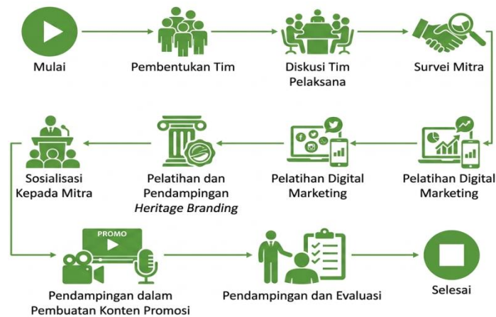
Gambar 3. Tahapan Pelaksanaan

Dilakukan di awal program dengan melibatkan mitra, ketua RT/RW setempat, serta anggota dosen dan mahasiswa pengabdian. Kegiatan ini bertujuan menjelaskan tujuan, tahapan, peran masing-masing pihak, dan hasil yang diharapkan dari program (Utami Putri et al., 2021).