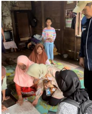
Gambar 2. Survei Awal Mitra

Dengan adanya kegiatan ini, UMKM tenun songket di Desa Kota Daro II diharapkan dapat bertransformasi menjadi usaha yang lebih terorganisir, memiliki identitas branding yang kuat, serta mampu memanfaatkan digital marketing untuk memperluas pasar. Lebih dari itu, program ini diharapkan dapat menjadi model pengabdian yang aplikatif dan dapat direplikasi pada desa binaan Universitas Sriwijaya lainnya maupun wilayah lain di Sumatera Selatan yang memiliki potensi ekonomi kreatif berbasis budaya.