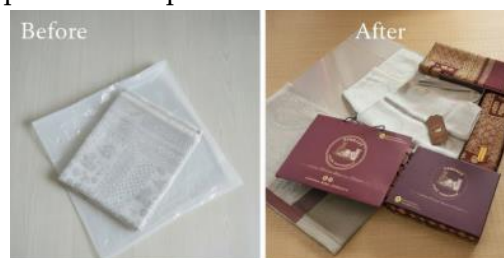
Gambar 8. Hasil Sebelum dan Sesudah Pelaksanaan Pengabdian

Beberapa contoh kain songket yang telah dibuat oleh para pengrajin Songket Daro Sriwijaya. Melalui pendekatan heritage branding , gambar ini menunjukkan bagaimana motif songket diangkat kembali sebagai nilai jual utama ( unique selling point ). Makna di balik motif dalam bentuk katalog digital dan fisik ini berfungsi sebagai instrumen edukasi bagi konsumen, sekaligus sebagai upaya pelestarian kekayaan intelektual budaya lokal yang menjadi pembeda utama dari produk kompetitor.