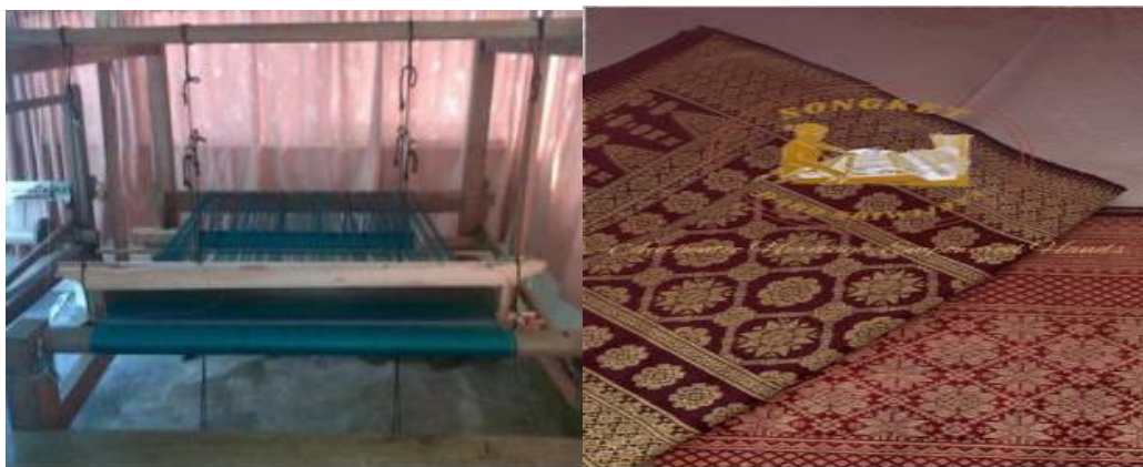
Gambar 1. Alat dan Hasil Tenun Songket

Kegiatan pengabdian ini memiliki tujuan untuk memberdayakan UMKM tenun songket Desa Kota Daro II agar lebih mandiri, berdaya saing, dan berkelanjutan. Dari sisi pembangunan global, kegiatan ini selaras dengan beberapa tujuan Sustainable Development Goals (SDGs), yaitu SDG 1 tentang Tanpa Kemiskinan melalui peningkatan pendapatan pelaku UMKM, SDG 8 tentang Pekerjaan Layak dan Pertumbuhan Ekonomi melalui peningkatan kapasitas usaha,