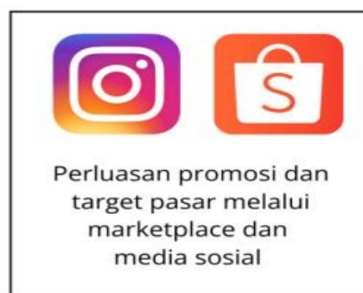
Gambar 4. Teknologi dan Inovasi Promosi dan Pemasaran

Selain pelatihan penerapan branding baru tidak sekadar membuat logo, melainkan membangun ulang identitas usaha yang berbasis pada nilai warisan lokal (heritage) untuk menciptakan diferensiasi di pasar. Kemasan berperan sebagai silent salesman yang pertama kali berinteraksi dengan konsumen. Oleh karena itu, strategi pengemasan yang diterapkan adalah peralihan dari kemasan konvensional menuju kemasan modern yang mengedepankan estetika, fungsionalitas, dan identitas merek. Dengan kemasan yang modern dan elegan, daya tarik produk di rak toko meningkat, persepsi nilai produk naik, dan konsumen lebih terdorong untuk membeli sekaligus membagikannya ke media sosial. Digitalisasi pemasaran dilakukan sebagai sebuah ekosistem terintegrasi, bukan hanya sekadar membuat akun media sosial. Pembuatan akun resmi UMKM di media sosial dan marketplace, Setiap akun dioptimalkan secara penuh, foto profil menggunakan logo terbaru. Penerapan strategi konten digital foto produk dan video storytelling, agar keberlanjutan digitalisasi terjamin, tim UMKM diberikan pelatihan intensif selama sehari secara praktik langsung (Nopriani & Misnawati, 2024).