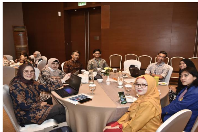
Gambar 1. Tahap persiapan

Kegiatan PKM ini menggunakan pendekatan partisipatif dan edukatif dengan melibatkan mahasiswa sebagai subjek utama dalam proses pembelajaran. Pendekatan ini dipilih karena mampu meningkatkan keterlibatan peserta secara aktif dan mendorong proses pembelajaran yang lebih bermakna (Kolb, 1984; Knowles, 1990). Metode pelaksanaan dibagi ke dalam beberapa tahapan sistematis.