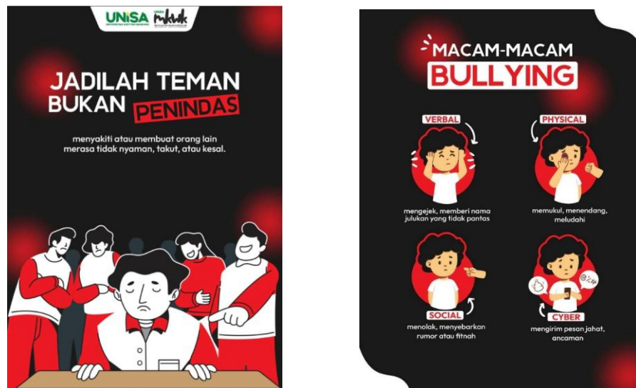
Gambar 4. ilustrasi komunikasi visual

Efektivitas kegiatan ini tidak terlepas dari penggunaan ilustrasi sebagai media utama dalam proses edukasi. Ilustrasi berperan penting dalam menjembatani kesenjangan antara konsep abstrak dan realitas yang dapat dipahami oleh peserta. Dalam konteks ini, ilustrasi tidak hanya berfungsi sebagai elemen visual pendukung, tetapi sebagai medium utama dalam menyampaikan pesan. Penelitian menunjukkan bahwa penggunaan visual dalam pembelajaran mampu meningkatkan pemahaman hingga tingkat yang jauh lebih tinggi dibandingkan pendekatan berbasis teks semata (Houts et al., 2006; Mayer, 2009). Hal ini terjadi karena ilustrasi mampu mengaktifkan sistem kognitif ganda (dual coding), di mana informasi diproses melalui jalur visual dan verbal secara bersamaan, sehingga memperkuat daya ingat dan pemahaman. Dalam kegiatan ini, ilustrasi digunakan untuk menggambarkan situasi nyata yang sering terjadi di lingkungan kampus, seperti catcalling, pelecehan berbasis relasi kuasa, dan bentuk-bentuk manipulasi emosional. Visualisasi tersebut membantu peserta untuk melihat secara konkret bagaimana kekerasan seksual dapat terjadi dalam kehidupan sehari-hari, bahkan dalam bentuk yang sebelumnya tidak mereka sadari.