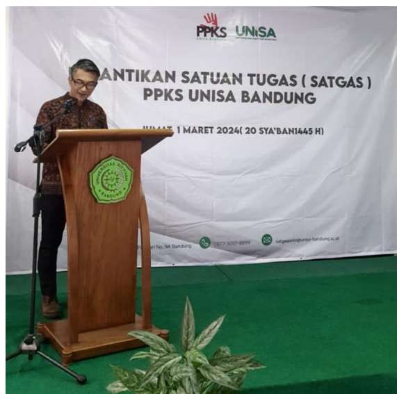
Gambar 2. Pemebntukan dan sosialisasi

Tahap pertama adalah tahap persiapan, yang meliputi identifikasi kebutuhan peserta, penyusunan materi, serta perancangan modul pelatihan. Identifikasi dilakukan melalui observasi awal dan diskusi dengan pihak kampus untuk mengetahui tingkat pemahaman mahasiswa terkait kekerasan seksual (Creswell, 2014; Sugiyono, 2019). Materi yang disusun mencakup definisi kekerasan seksual, jenis-jenisnya, dampak psikologis, serta peran ilustrasi dalam komunikasi visual.