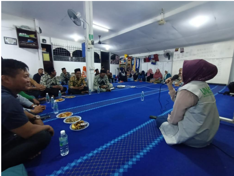
Gambar 2. Pelaksanaan Metode Kegiatan

meningkatkan rasa kepemilikan terhadap program yang dilaksanakan dan memperkuat kerinduan hasil kegiatan pengabdian.