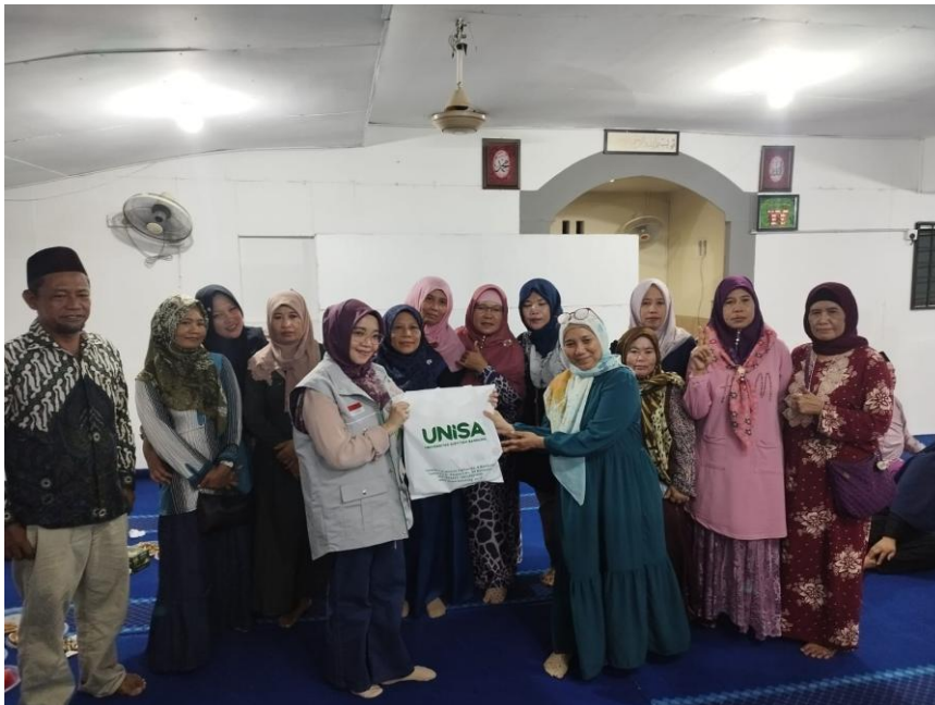
Gambar 1. Pelaksanaan Kegiatan

kemandirian masyarakat dalam menjaga kesehatan. Model pemberdayaan komunitas peduli hipertensi berbasis Partisipan